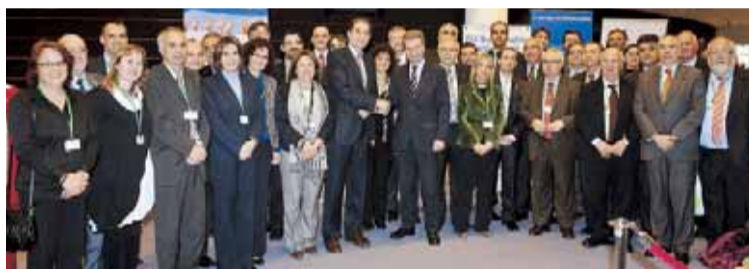
FOTO DELS ALCALDES A BRUSEL·LES