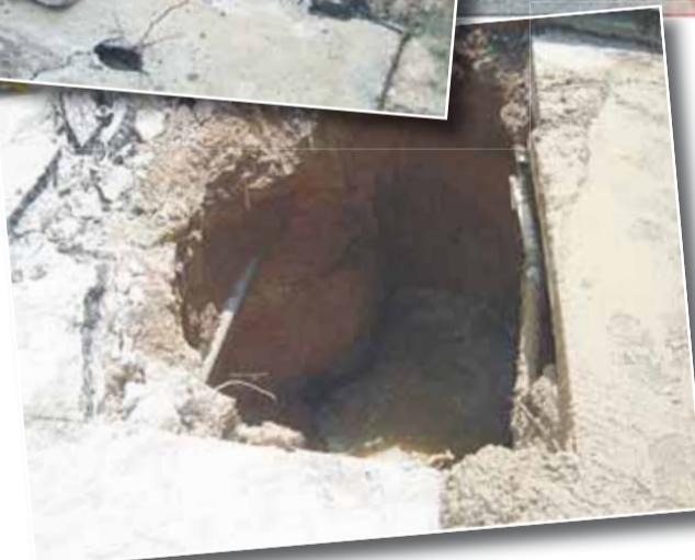
FOTOS DE LA CALÇADA PRÈVIES A LA INTERVENCIÓ

Durant el mes d'agost s'ha reparat la xarxa de