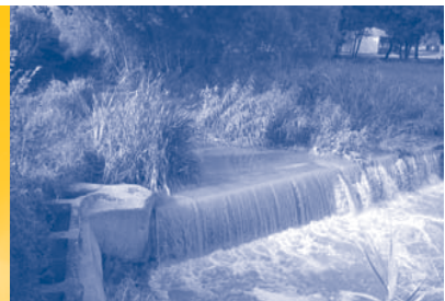
butlletí quinzenal d'informació municipal de l'Ajuntament de Lliçà d'Amunt / 1 de febrer de 2005