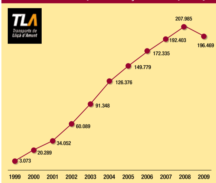
Utilització de Transports de Lliçà d'Amunt per anys

Aquest descens del passatge ha estat motivat per causes diverses. El context de crisi en què ens trobem immersos propicia que menys persones es desplacin per motius laborals i que altres minimitzin el nombre de desplaçaments. A tot això cal afegir les vagues del transport dels passats 29 i 30 d'octubre i 11 i 12 de novembre, que trenquen les dinàmiques del servei i arrosseguen els seus efectes negatius durant els dies posteriors, ja que generen desconfiança als usuaris. Si tenim present que cada dia fan servir el transport urbà unes 800 persones, només això ja ens dona prop de 4.000 usuaris perduts per l'efecte dels dies de vaga. Tot i això, el nostre servei gaudeix de bona salut i ha resistit prou bé aquets efectes nega-