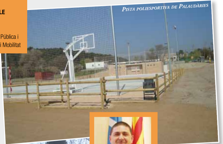
PISTA POLIESPORTIVA DE PALAUDÀRIES