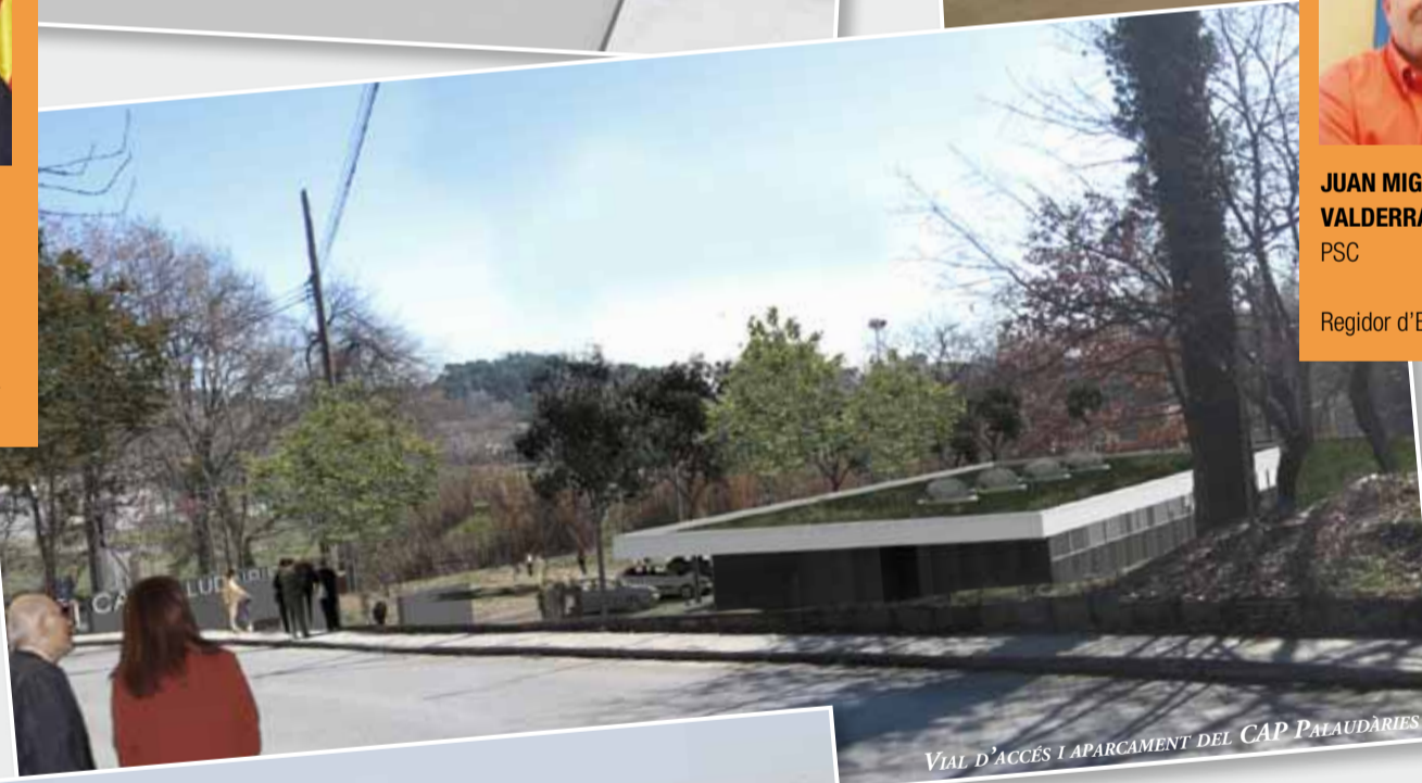
VIAL D'ACCÉS I APARCAMENT DEL CAP PALAUDÀRIES