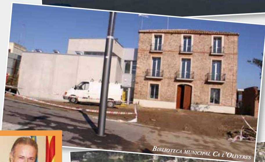
BIBLIOTECA MUNICIPAL CA L'OLIVERES