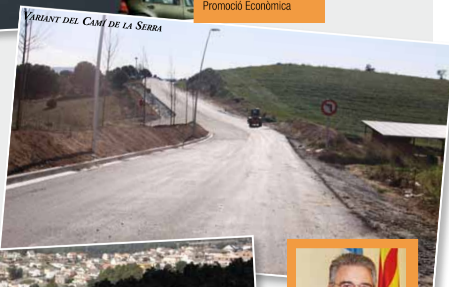
VARIANT DEL CAMÍ DE LA SERRA