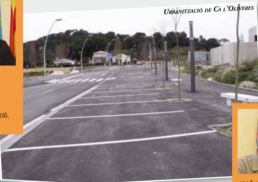
URBANITZACIÓ DE CA L'OLIVERES

Regidor de Cooperació, Cultura i Joventut