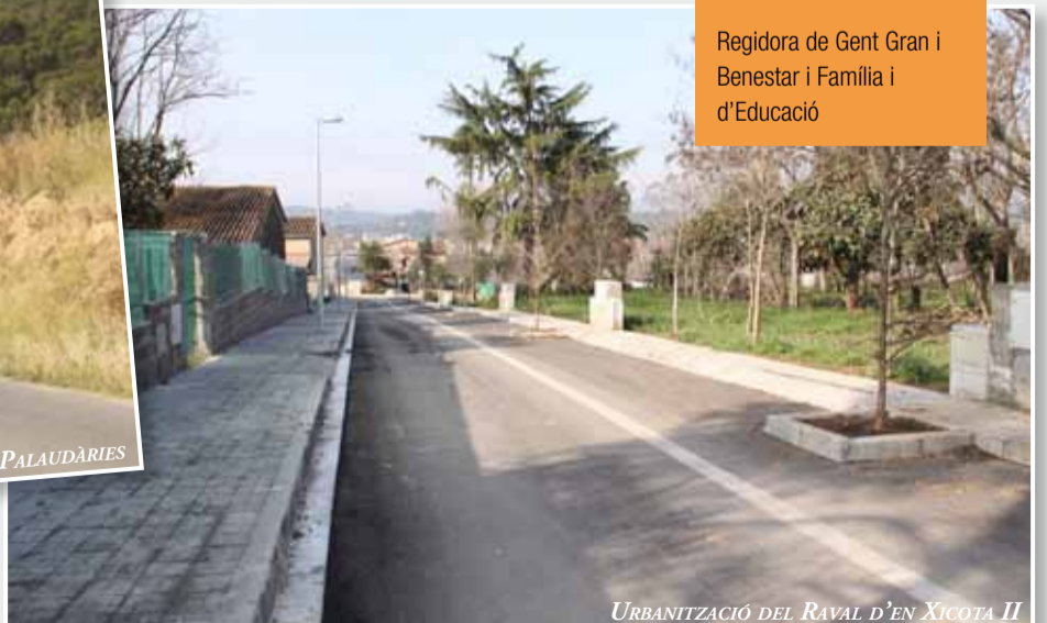
URBANITZACIÓ DEL RAVAL D'EN XICOTA II