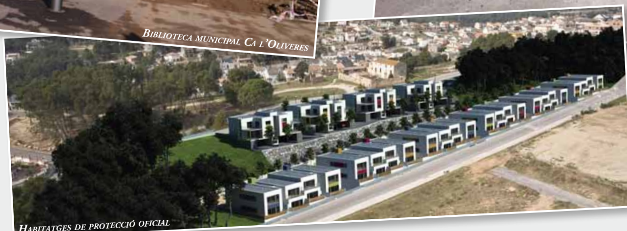
HABITATGES DE PROTECCIÓ OFICIAL