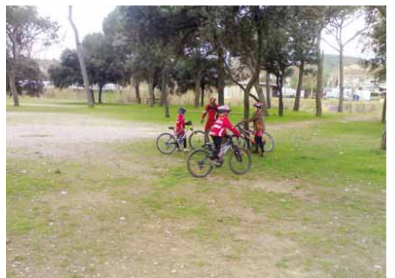
PASSEJADA-PEDALADA EN BTT DE L'AMUNT CLUB CICLISTA