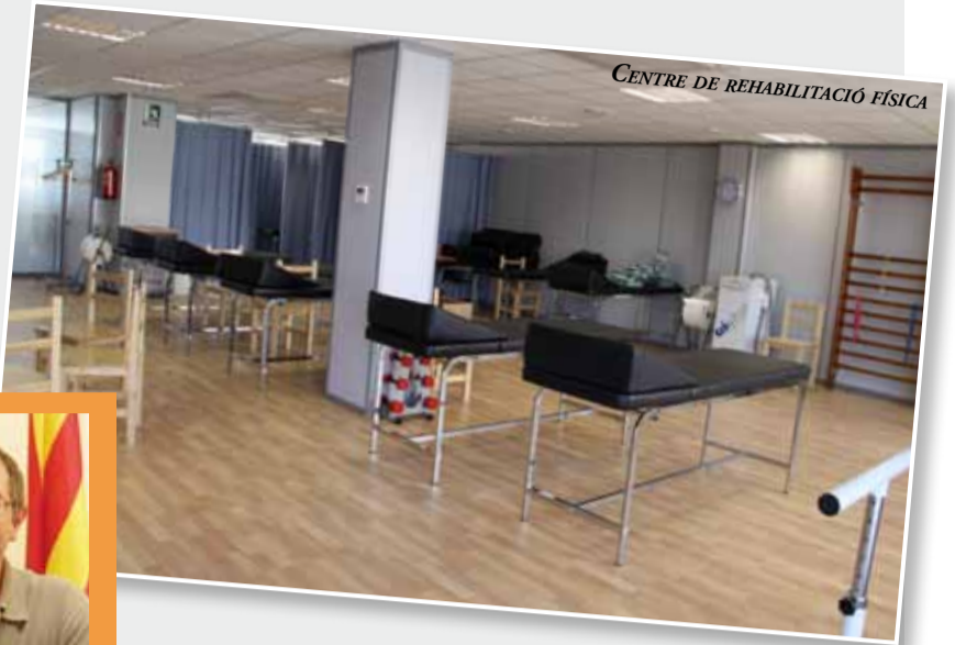
CENTRE DE REHABILITACIÓ FÍSICA