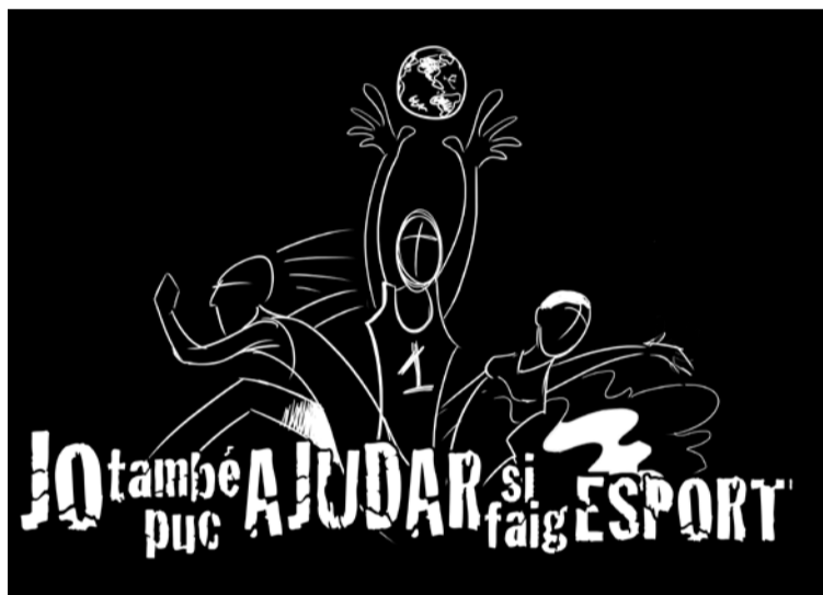
LOGOTIP DE LA CAMPANYA

El diumenge va haver-hi una Passejada-Pedalada en BTT amb botifarrada final, que va permetre conèixer alguns indrets del municipi i va acabar amb un bon esmorzar; una Jornada de futbol sala, amb