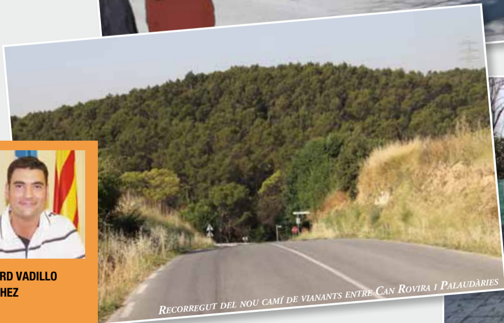
RECORREGUT DEL NOU CAMÍ DE VIANANTS ENTRE CAN ROVIRA I PALAUDÀRIES