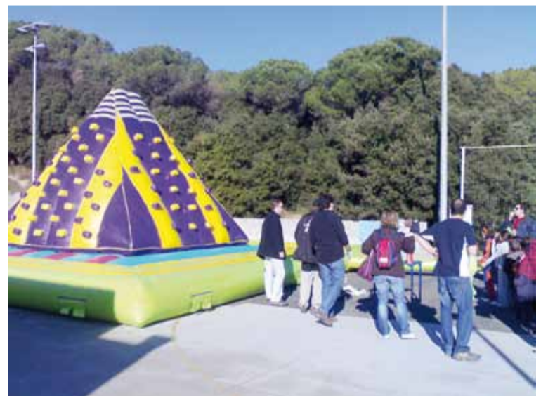
ROCÒDROM INFLABLE DE LA COMISSIÓ DE FESTES