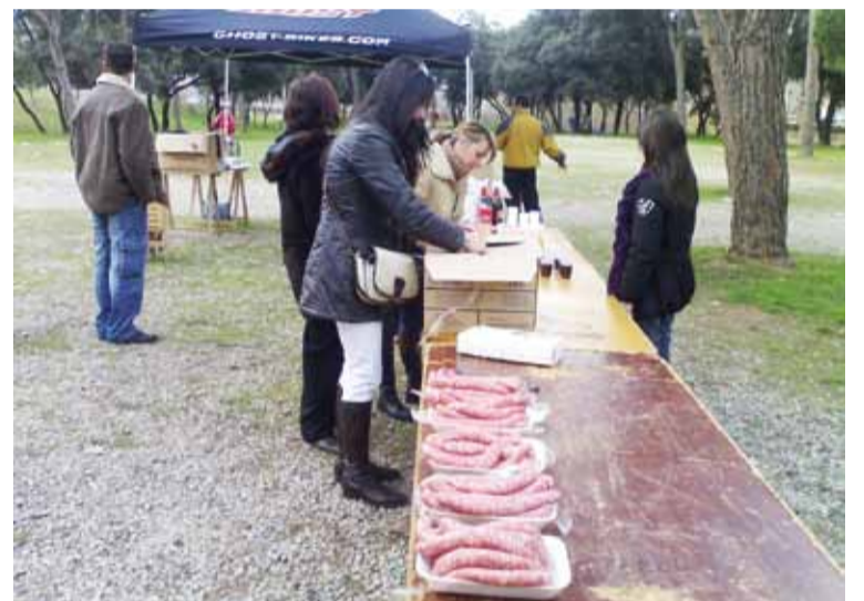
BOTIFARRADA DE L'AMUNT CLUB CICLISTA

També dóna les gràcies especialment a l'Associació de Veïns de Can Costa, al Club Bàsquet Lliçà d'Amunt, a la Comissió de Festes, a la Societat de Coloms Esportius, a l'Amunt Club Ciclista, al Club Esportiu Lliçà d'Amunt, al Club de Futbol Sala Lliçà d'Amunt, al Grup de Ball i Espectacles Starlets, a totes les entitats de la lliga de lleure de Botxes i a tots els equips de la lliga de lleure de Futbol Sala, a més d'al BTT Concos.