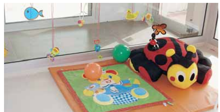
INTERIOR ESCOLA BRESSOL MUNICIPAL

Institut (Batxillerat): del 10 al 21 de maig