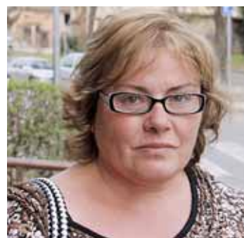
Antonio Sánchez Barri Centre

A mi me parece muy bien, que se mejore la presencia policial. Está bien.