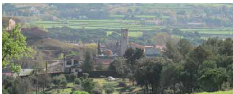
IMATGE GENERAL DE LLIÇÀ D'AMUNT

Un altra dada reveladora és que només el 4,16% de la població actual fa més de 40 anys que hi viu. Això denota el gran creixement demogràfic que ha viscut el municipi en