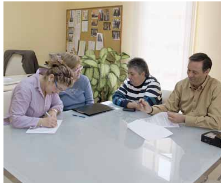
MOMENT DE LA SIGNATURA

legals de l'AV, inicià un procés de suport a l'entitat amb l'execució de la remodelació del local i el convertí en equipament municipal amb la categoria de local social.