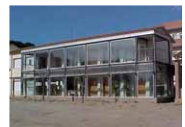
SEU DE LA ESCOLA A LLIÇÀ D'AMUNT