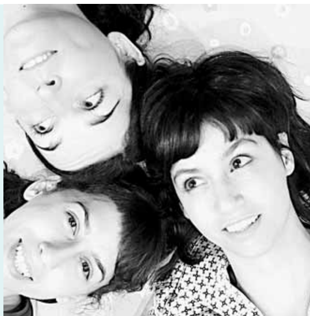
Cartell de l'obra