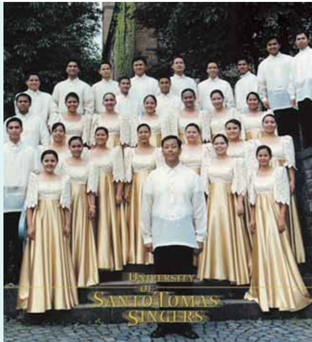
Cor UST Singers