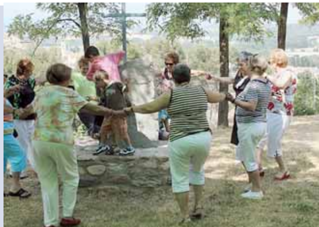
Aplec de l'any passat

Tomas" de Manila (Filipines), la universitat més antiga d'Àsia. El cor el dirigeix el Professor Fidel G. Catalang Jr. i estarà a Catalunya entre el 10 i el 14 de maig. El concert de l'Aliança és una oportunitat única per poder escoltar a Lliçà d'Amunt aquest cor que combina la seva capacitat vocal i interpretativa amb un espectacle d'escena impressionant dalt de l'escenari amb tot tipus d'estils de música, i que estan guanyant tots els concursos internacionals als que es presenten. Les entrades es poden adquirir el mateix dia del concert o bé de manera anticipada a l'Ajuntament de Lliçà d'Amunt. El preu de l'entrada és de 5 €. Per a estudiants i jubilats l'entrada és de 3 €.