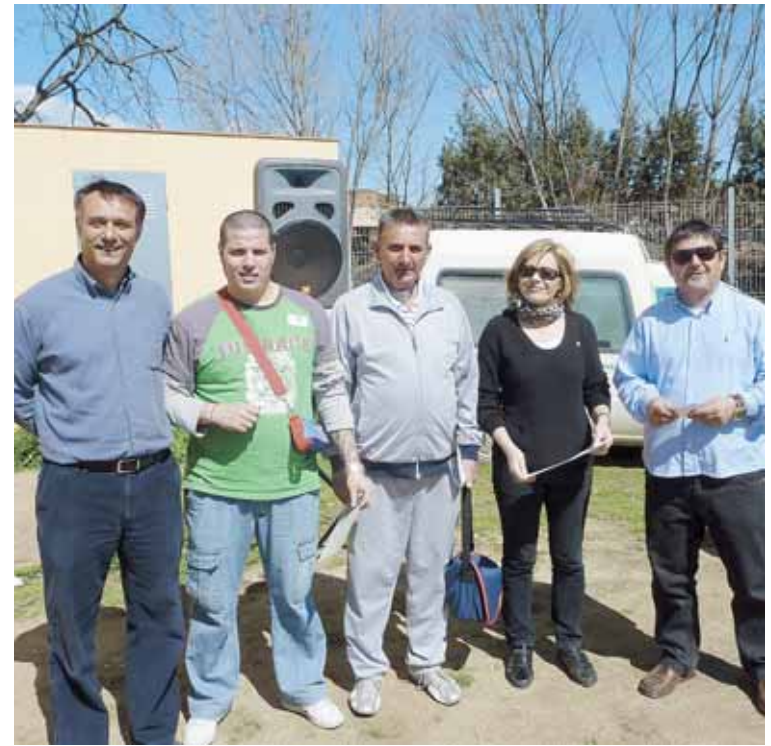
GUANYADORS DEL TORNEIG

El torneig va ser un gran èxit de participació: unes 150 persones dels diferents equips que participen habitualment a la Lliga de Botxes del Ajuntament van participar en el torneig, ja que aquest esport té molta afició en el nostre poble. Es van donar premis als sis primers classificats.