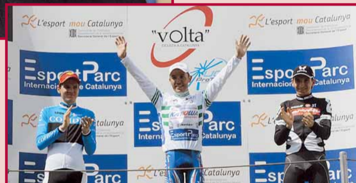
PODIUM VOLTA CICLISTA CATALUNYA

Suposo que el fet de veure l'afició que hi havia a la meua família em va ajudar molt. El meu pare era director d'un equip i el meu germà gran també corria i de petit sempre em portaven a les carreres i veia el dia a dia d'un ciclista.