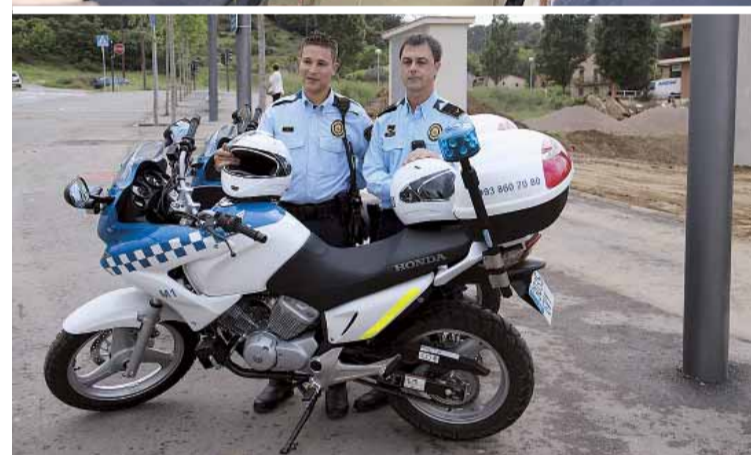
PRESENTACIÓ I MOTOS DE LA POLICIA DE PROXIMITAT

De moment aquesta nova unitat ja ha començat a treballar amb un seguit de jornades