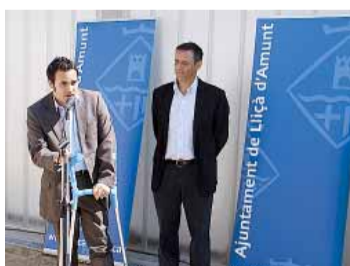
MOMENT DE LA INAUGURACIÓ

L'espai lúdic és un circuit de salut constituït per diferents mòduls d'activitats que formen un recorregut que permet treballar les facultats físiques i sensorials de la gent gran, en