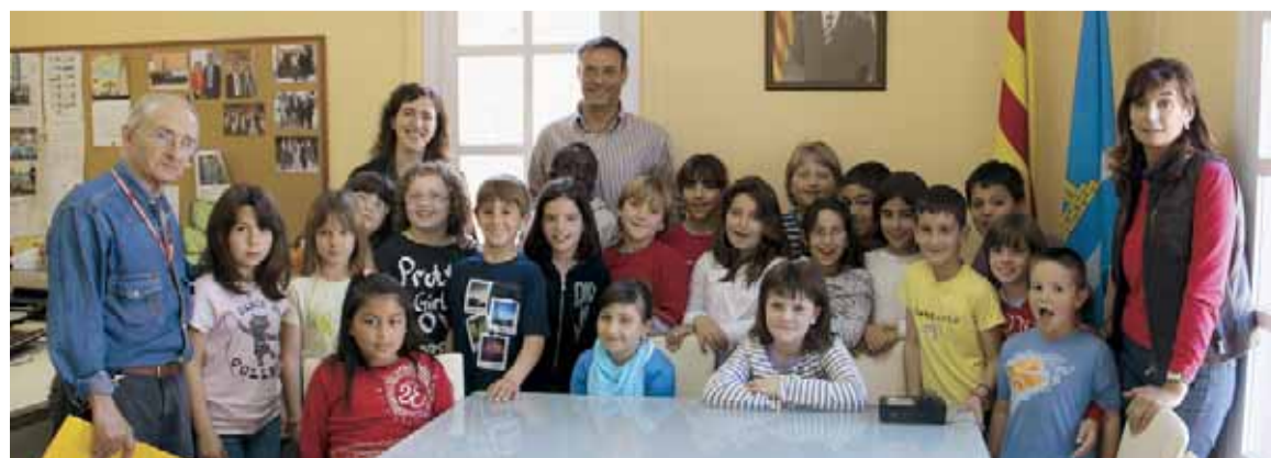
ALUMNES DE 3R DEL CEIP PAÏSOS CATALANS