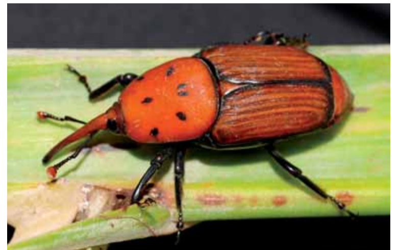
ESCARBAT MORRUT ROIG

85% WP. Dels productes esmentats només el Fenitrotion 40% CS i l'Imidacloprid 20% SL estan autoritzats en l'àmbit d'utilització de parcs i jardins. Es pot addicionar un adherent, per tal de millorar la persistència i altres característiques dels productes insecticides.