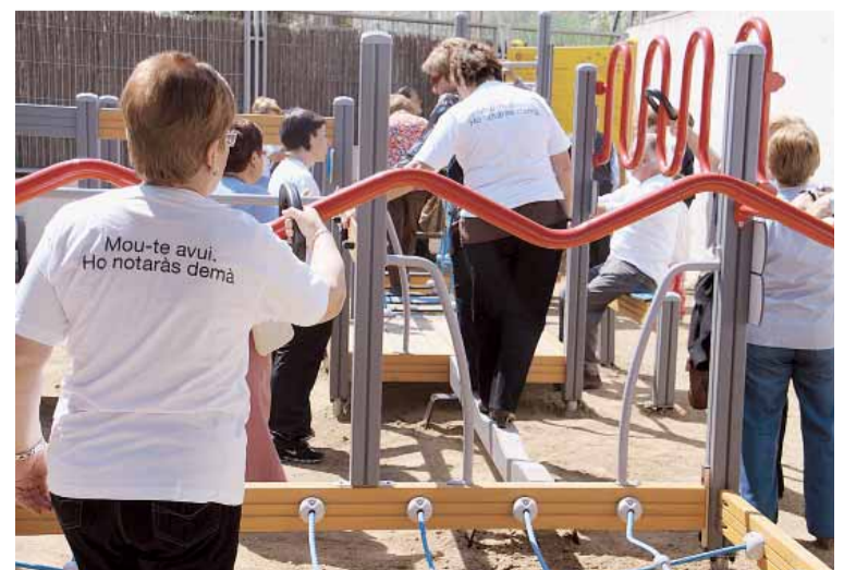
GENT GRAN A L'ESPAI LÚDIC

ció. Després dels parlaments, una monitora va explicar a tots els presents el funcionament dels diferents elements del circuit i va animar als més grans allà presents a provar i gaudir de l'espai. Des de la regidoria d'Esports està previst organitzar un seguit de sessions formatives amb monitor per a grups de gent gran per tal que puguin optimitzar al màxim tots els elements dels quals disposa l'espai lúdic i de salut.