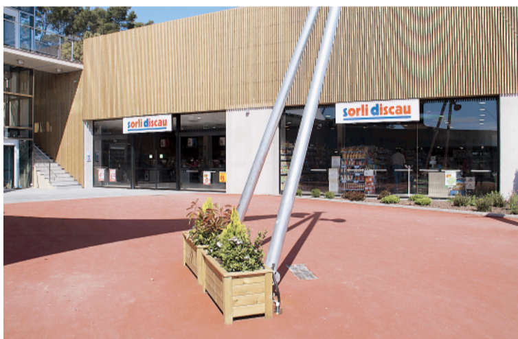
SUPERMERCAT A CA L'ARTIGUES