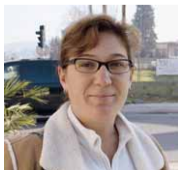
Pedro Ladero Centre urbà

Em sembla bé. Serà més còmode per pagar.