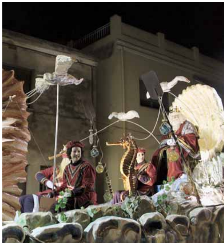
CAVALCADA DE REIS