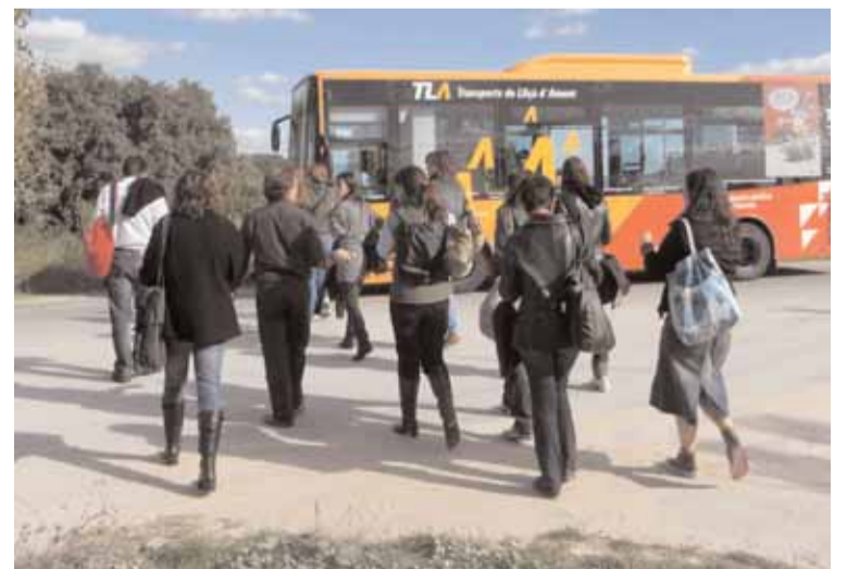
PROFESSORS DURANT EL RECORREGUT

recorregut amb els Transports de Lliçà d'Amunt, a llarg de les línies LA1 i LA2, mentre un tècnic els va explicant la singularitat dels indrets per on es passa i les característiques més rellevants del municipi. També se'ls lliura documentació cartogràfica i estadística, que pot ser d'utilitat pel seu dia a dia amb els alumnes.