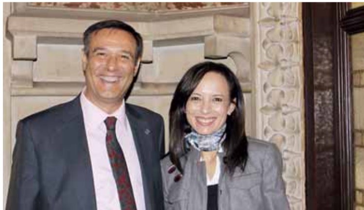
L'ALCALDE AMB LA MINISTRA DE VIVENDA

de 23 acords que suposen una inversió de 16,6 milions d'euros destinats a la construcció o rehabilitació de més de 3.000 habitatges a Catalunya.