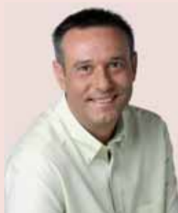
Ignasi Simón Ortoll Alcalde

Tot i la gran dificultat d'elaborar els pressupostos, degut a la gran minva dels ingressos ordinaris, comencem l'any 2010 amb el pressupost de l'Ajuntament aprovat i això ens permet no aturar ni un sol segon el motor d'aquesta administració local i poder, així, seguir a tota marxa complint amb els nostres objectius del programa de govern, però amb seny, sense sobrepassar, en cap moment, els límits dels ratis legals d'endeutament.