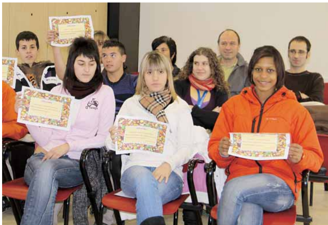
IMATGE DEL MOMENT DEL LLIURAMENT DELS DIPLOMES

Gràcies a la implicació de l'alumnat que integra el projecte, els tallers preprofessionalitzadors tindran continuïtat durant el primer trimestre de 2010.