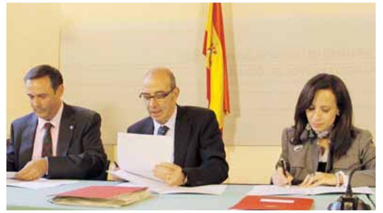
SIGNATURA DE L'ACORD