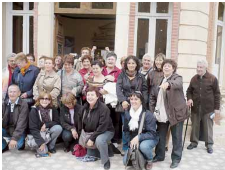
PARTICIPANTS A L'EXCURSIÓ

L'excursió va ser molt interessant i va comptar amb les aportacions d'una guia que va proporcionar tota la informació necessària per comprendre la gran tasca de l'Elisabeth.