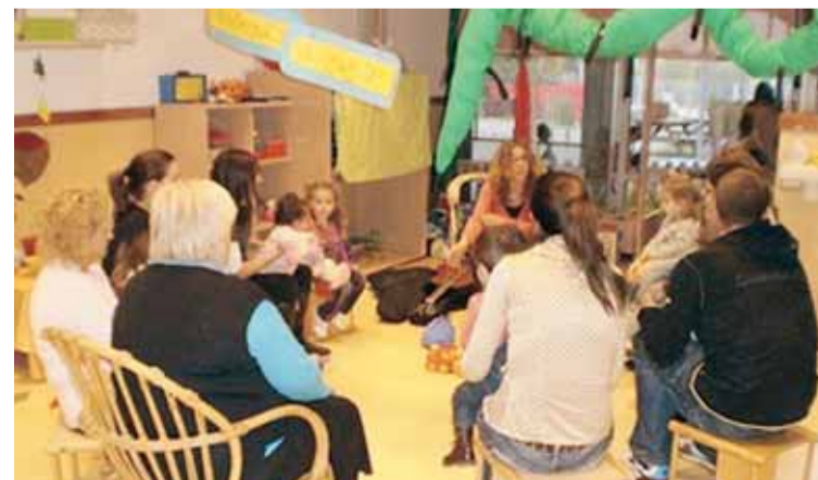
TALLER DE MOIXAINES I JOCS DE FALDA

on es tractaran temes per donar suport en el creixement del fill o filla. També hi haurà uns tallers de massatges infantils a les dues escoles bressol municipals on, a través del tacte, la música i el moviment, s'aprendrà a estimular els sentits dels més petits.