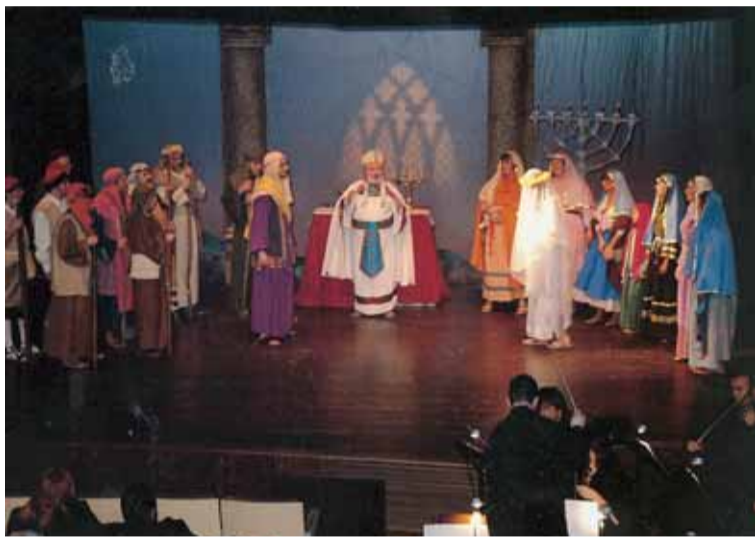
ESCENA DEL TEMPLE

De la programació d'activitats d'aquestes festes nadal·lenques n'hem de destacar una de molt especial: "Tornen els Pastorets a Lliçà d'Amunt!", un espectacle que no us podeu perdre. Les representacions tindran lloc el dissabte 2 i el diumenge 3 de gener, a les 19 h, a l'Ateneu l'Aliança. L'Ajuntament, després de molts anys d'absència, ha tornat a programar Els Pastorets. Per això, es va demanar la col·laboració