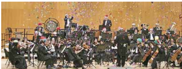
ORQUESTRA SIMFÒNICA DE SANT CUGAT

Per assistir a aquest acte, cal recollir invitacions (màxim dues persones) a l'OAC de l'Ajuntament, de 9 a 13 h i de 16 a 19 h. Aforament limitat.