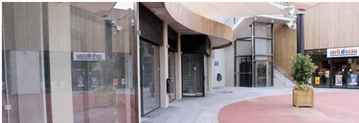
LOCALS COMERCIALS OFERTATS

El Plec de clàusules i la documentació que hem d'aportar la podeu trobar a la web de l'Ajuntament, a l'apartat EMO.