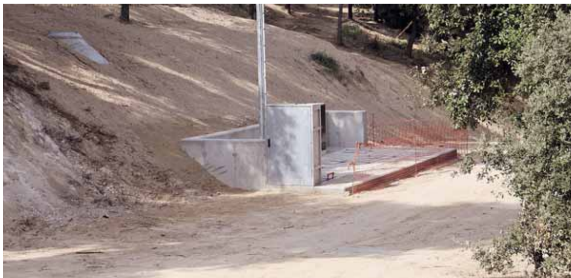
OBRA ACABADA DEL NOU COL·LECTOR

identificats de la xarxa de clavegueram municipal o baixa. D'acord amb el projecte executiu els punts d'abocament d'aigües residuals objecte de les obres han estat els carrers Penedés, Urgell, Priorat i Garrigues. A partir d'ara, tots aquells habitatges que tinguin un abocament incontrolat al bosc o a la llera del torrent, estaran obligats a connectar-se a la nova xarxa, bé sigui pel sistema de gravetat o a través d'un sistema particular de bombeig.