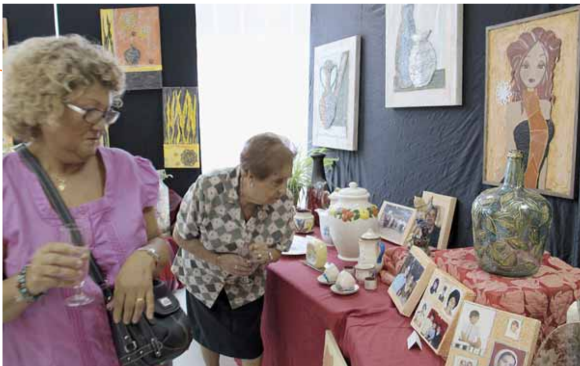
MOSTRA D'ART AL CASAL