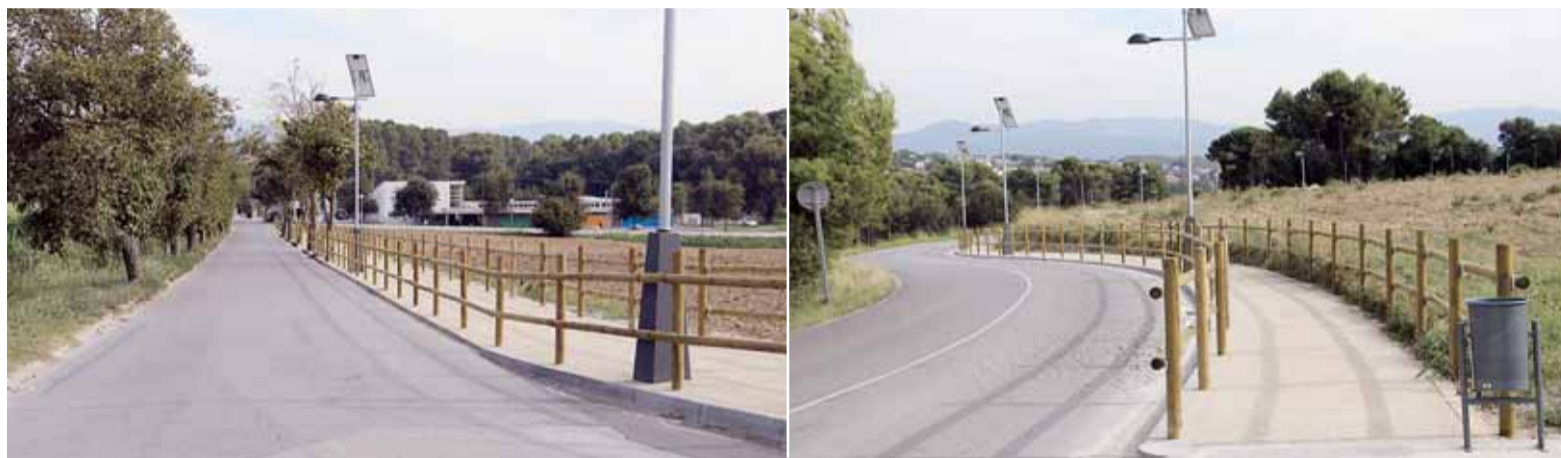
CAMÍ DE VIANANTS DE CAN ROVIRA

Aquesta obra, reclamada històricament per les entitats veïnals de la zona, ja és una realitat i facilitarà la circulació de vianants entre els barris de Can Rovira, Can Roure i Palaudalba.