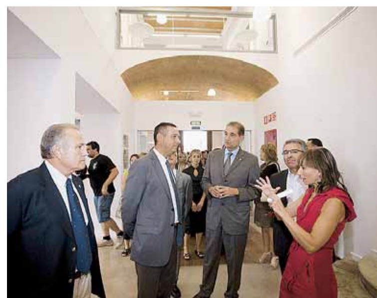
VISITA A L'INTERIOR DE LA BIBLIOTECA