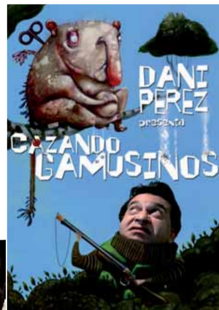
A DALT: CARTELL DE L'OBRA "CAZANDO GAMUSINOS" A L'ESQUERRA: MOMENT DE L'ESPECTACLE "LA SÍNDROME DE BUCAY"

Serà el dissabte 27 de novembre, a les 20 h, a l'Ateneu l'Aliança.