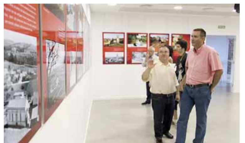
INAUGURACIÓ DE L'EXPOSICIÓ A LA BIBLIOTECA