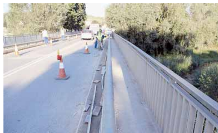
VORAL DEL PONT