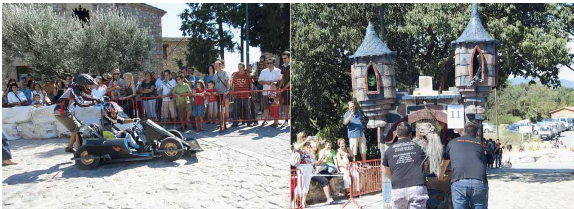
IMATGES DE LA BAIXADA DE CARRETONS I DE LA CERCAVILA DE LA JUGUESCA

tons pel barri de La Sagrera i el III Formigueig. La Baixada de Carretons, organitzada per la Colla de Carretons, va comptar amb la participació d'una quinzena d'originals carretons que van entretenir, al llarg del seu recorregut, a totes i tots els assistents. En el Formigueig, una vintena de grups i unes 300 persones van gaudir de les diferents proves d'aquesta gimcana. A la tarda, l'Orquestra Volcán va oferir el tradicional