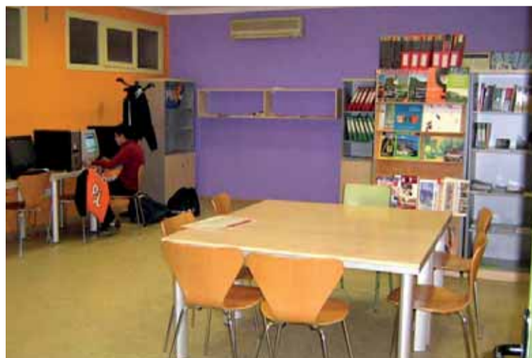
ESPAI JOVE EL GALLINER

A més, això ha permès ampliar l'horari de l'Espai Jove El Galliner, que també està obert els matins de dimarts i dijous perquè els joves puguin fer ús del Punt d'Informació Juvenil, l'espai de consulta, l'espai de