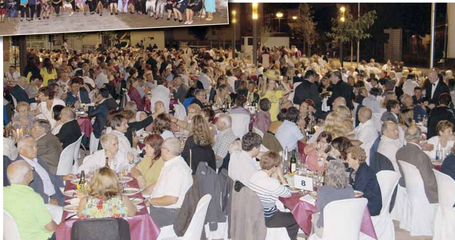
FOTO DE LES ÀVIES CUINERES DEL SOPAR I MOMENTS DEL SOPAR DE LES ÀVIES

El divendres 10 de setembre, dia de festa local, es va celebrar el dinar i la festa d'Homenatge a la Velleja, que va comptar amb més de 600 assistents. Després