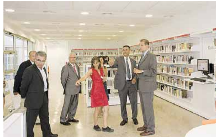
EXPLICACIONS DURANT EL RECORREGUT

Té un fons documental inicial de 21.100 documents i 128 subscripcions a diaris i revistes. Ofereix accés gratuït a Internet, zona Wi-Fi, informació i préstec i disposa d'una sala polivalent per a activitats. La biblioteca oferirà 34 hores i mitja de servei al públic.