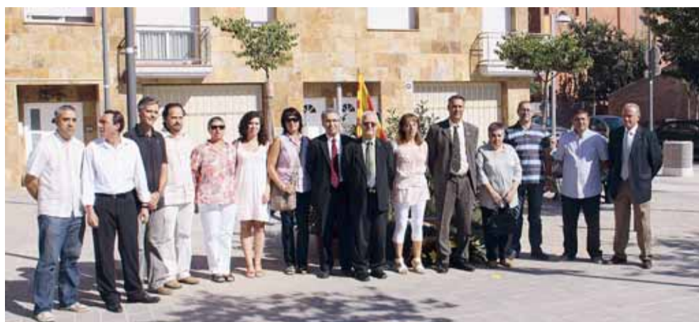
MEMBRES DEL CONSISTORI DESPRÉS DE L'OFRENA FLORAL