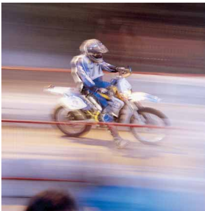
MOMENTS DE LA CURSA