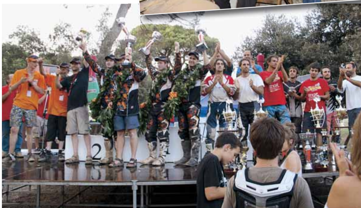
MOMENT DE L'HOMENATGE I GUANYADORS AL PÒDIUM