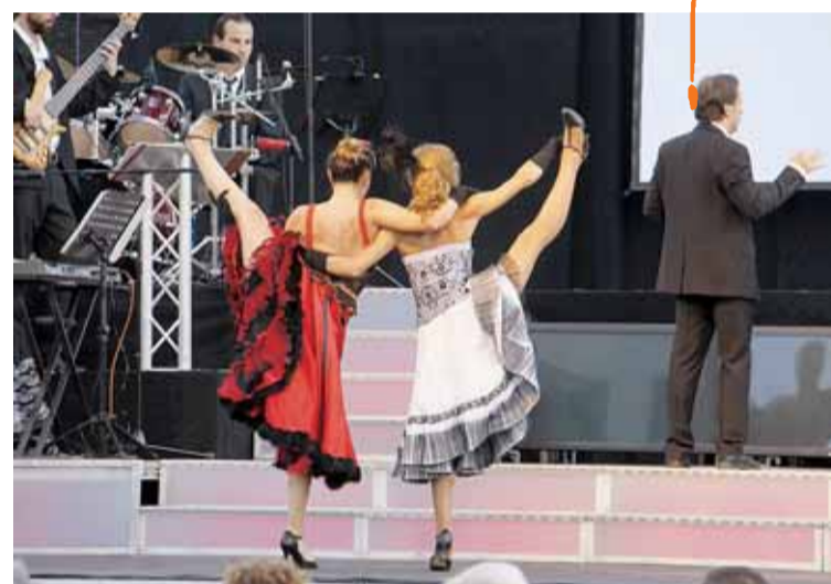
ESPECTACLE DEL CONCERT DE FESTA MAJOR