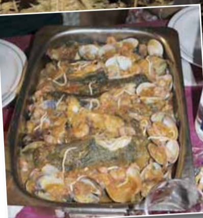
UN DELS SUCULENTS ÀPATS PREPARATS PER LES ÀVIES

El mateix divendres també van continuar les proves de La Juguesca amb el pregó a càrrec de la colla Can T'implora, guanyadora de La Juguesca 2009, i la Cercavila de Festa Major. La nit va estar marcada per l'actuació al Pinar de la