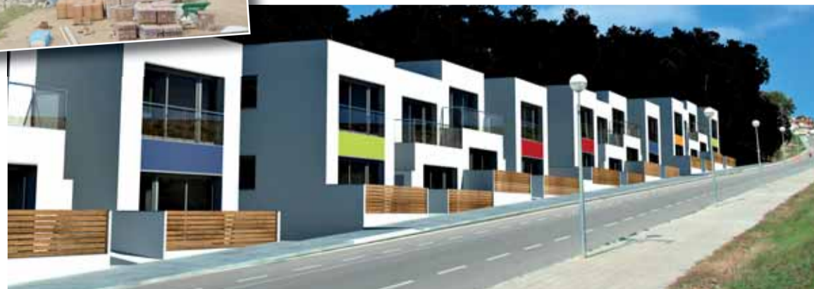
IMATGE VIRTUAL DELS HABITATGES DE PROTECCIÓ OFICIAL

Si et vols informar o inscriure't clica a sobre del nou banner d'HPO (Habitatges amb Protecció Oficial) ubicat a la pàgina web de l'Ajuntament. Si ho prefereixes, també pots dirigir-te a l'Empresa Municipal d'Obres (EMO), o bé a la regidoria pertinent.