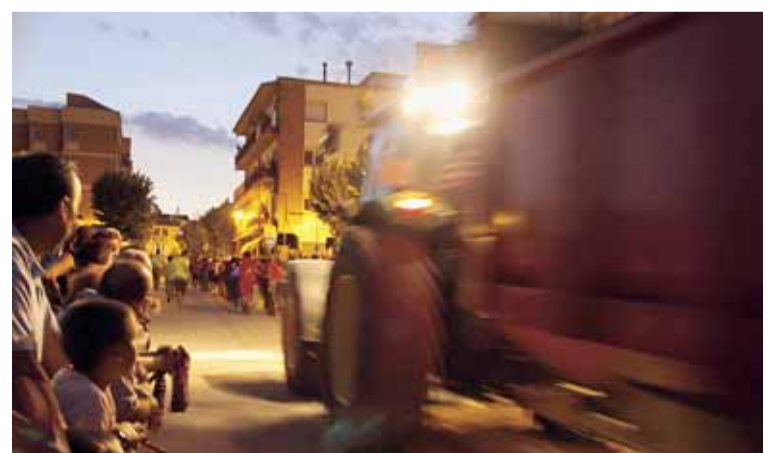
ESTRADA DE TRACTOR