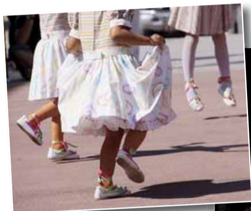
BALL DE GITANES I BALL DE FESTA MAJOR

final de La Juguesca que va donar la victòria a la colla dels Sporting l'Olla. El punt i final de la festa el va posar un espectacle pirotècnic al camp de futbol, on més de 1.500 persones van poder gaudir d'un dels millors espectacles pirotècnics dels darrers anys.