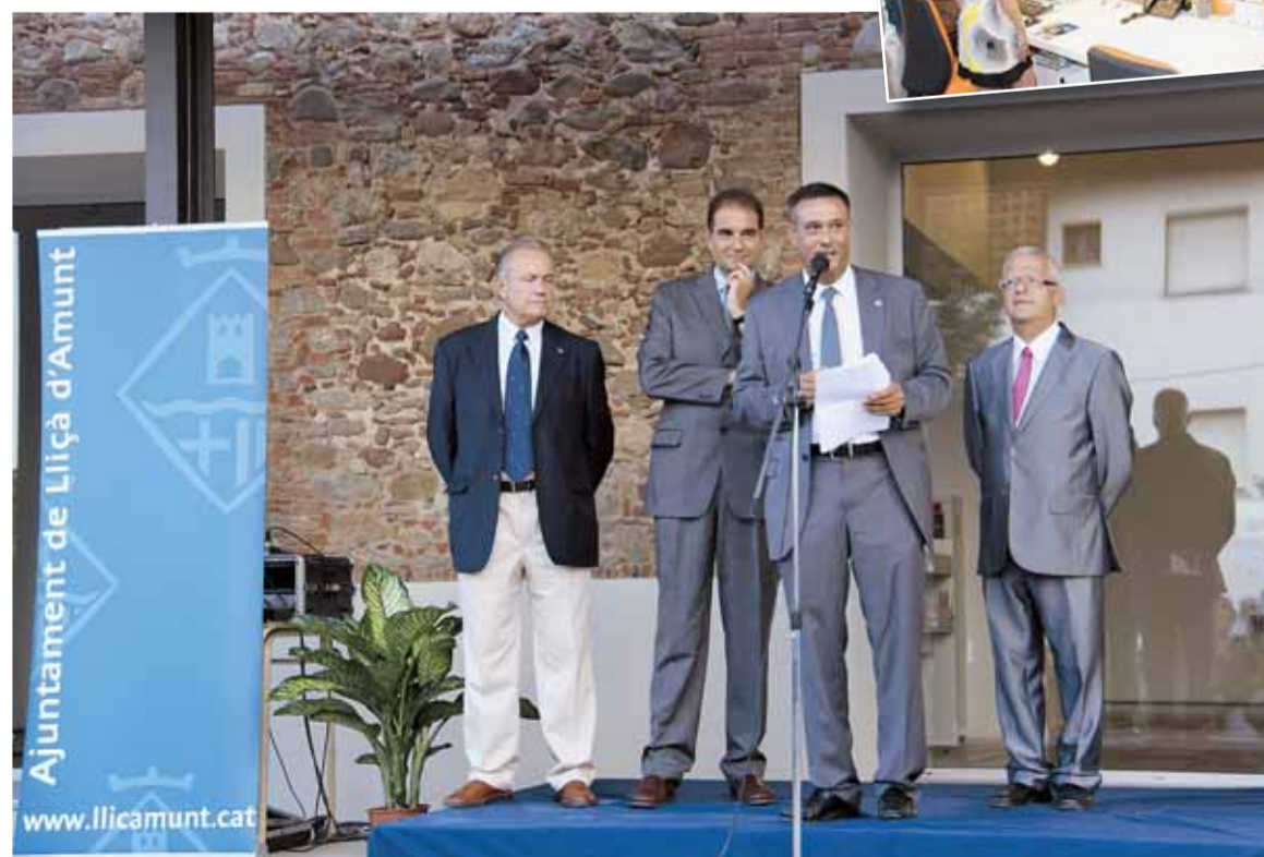
MOMENT DELS PARLAMENTS

aquest equipament, que dona centralitat al nostre poble i ofereix un servei cultural i de formació per a tothom". "Ara, només cal que els ciutadans i