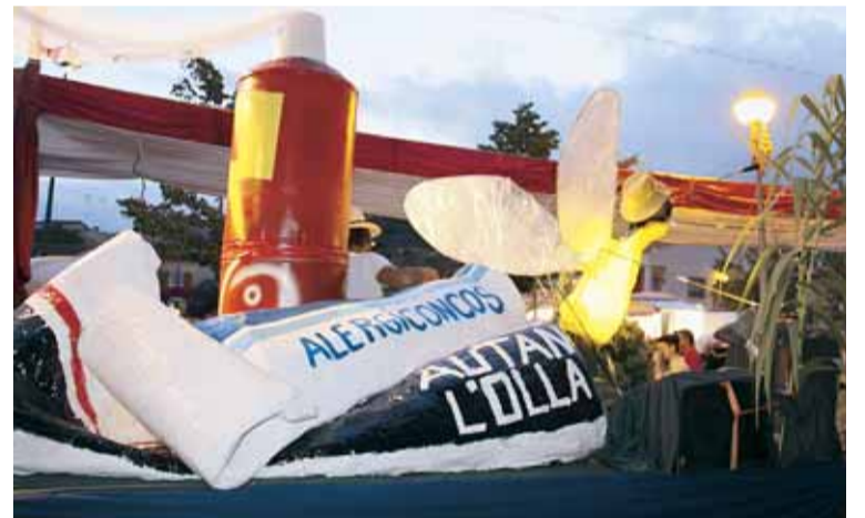
CERCAVILA DE LES COLLES