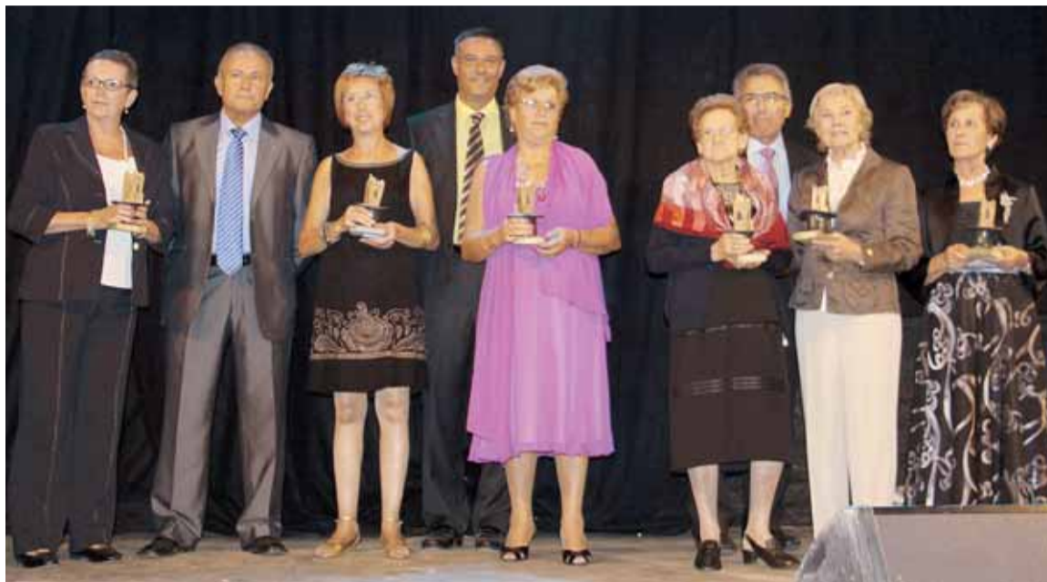
RECONeixEMENT AQUEST ANY A LA COMISSIO DEL SOPAR DE LES ÀVIES

Sin embargo, nada de esto sería posible sin el imprescindible apoyo del Ayuntamiento y en especial la labor coordinadora de la concejalía de Cultura, que nos da su apoyo. Sin el trabajo de la Comissió de les Àvies, que dedica muchos esfuerzos durante el año en la organización. Sin la labor de las comisiones que nos han precedido y llevado hasta aquí y a las que siempre