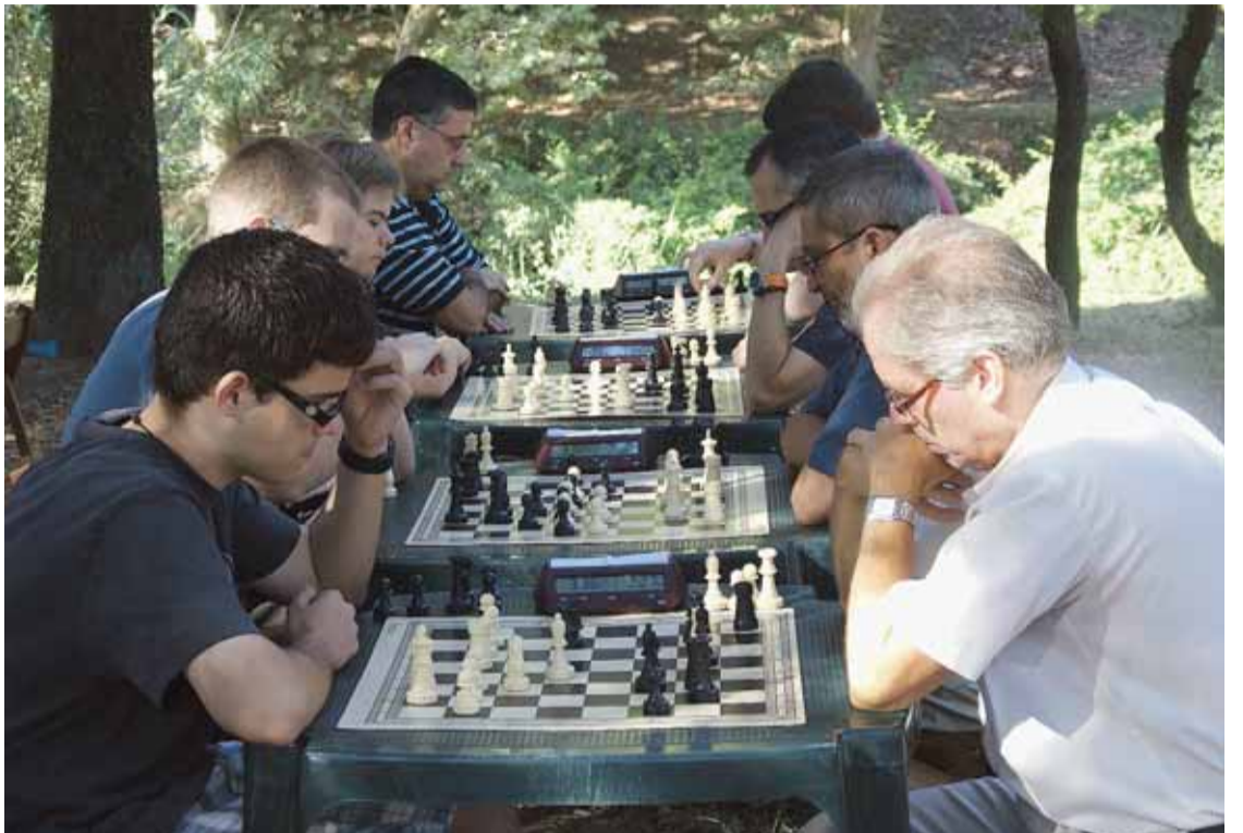
TORNEIG DE RÀPIDES D'ESCACS

Cor Colaverià l'Aliança, la Comissió d'Homenatge a la Vellesa i la Comissió del Sopar de les Àvies. Tot seguit va tenir lloc l'actuació del Ball de Gitanes i la III Baixada de Carre-