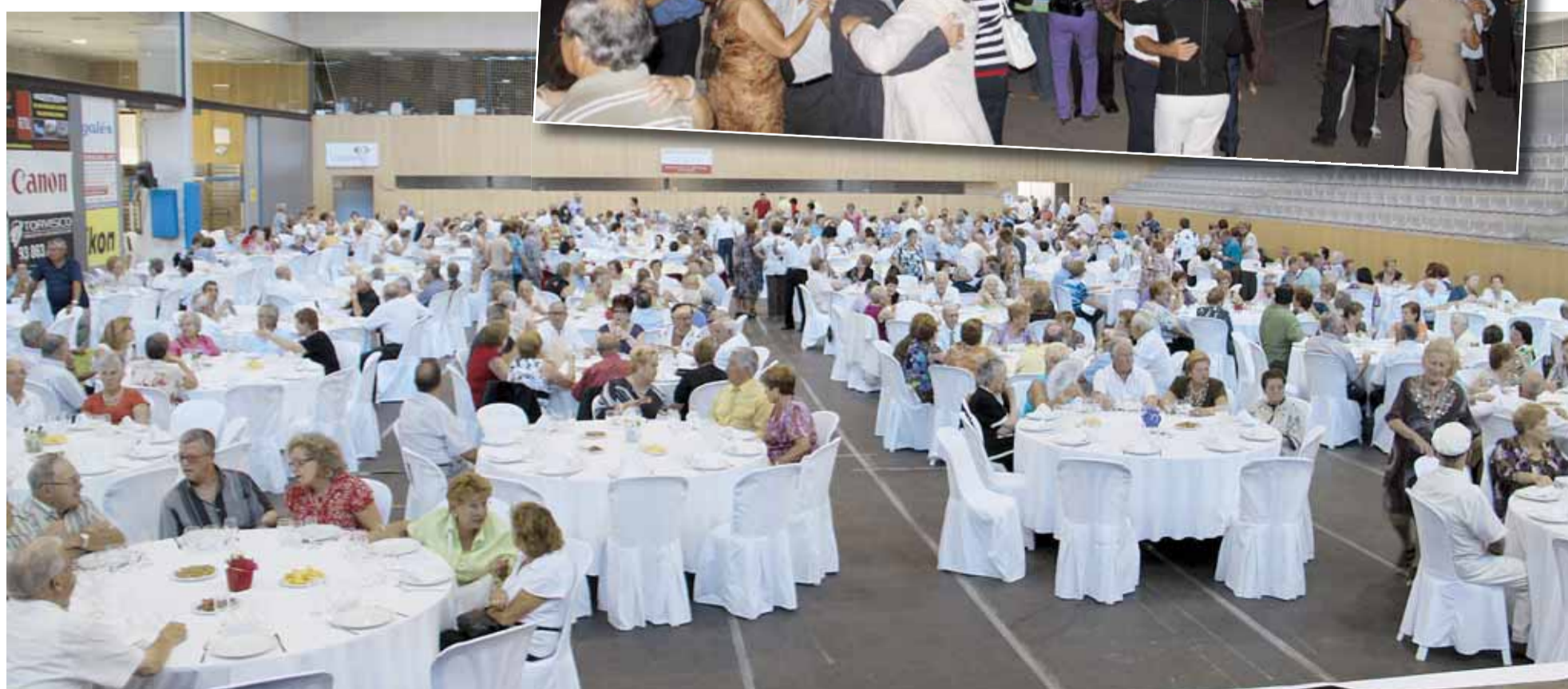
MOMENT DEL DINAR D'HOMENATGE A LA VELLESA