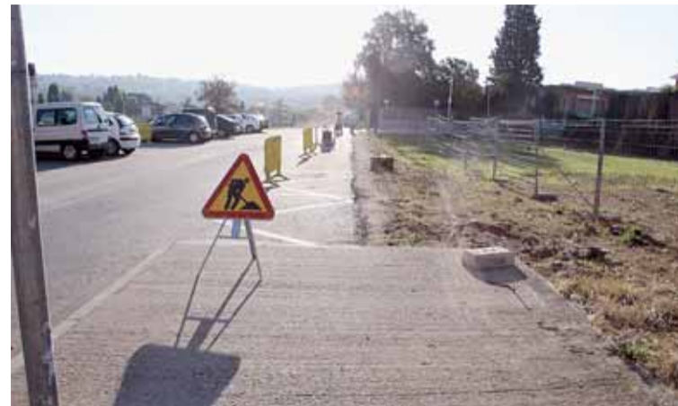
VORERA DEL TORRENT MERDANÇ

Abans l'amplada pel pas de vianants del pont era de 0,60 m, en cada sentit, i amb l'arranjament que s'ha executat arribarà fins els 0,90 m per banda, amb el que cada voral complirà amb la normativa actual. A les voreres es mantindran les proteccions interiors tubulars d'acer de 20 cm, ja que la velocitat màxima del tram és de 50 km/h.