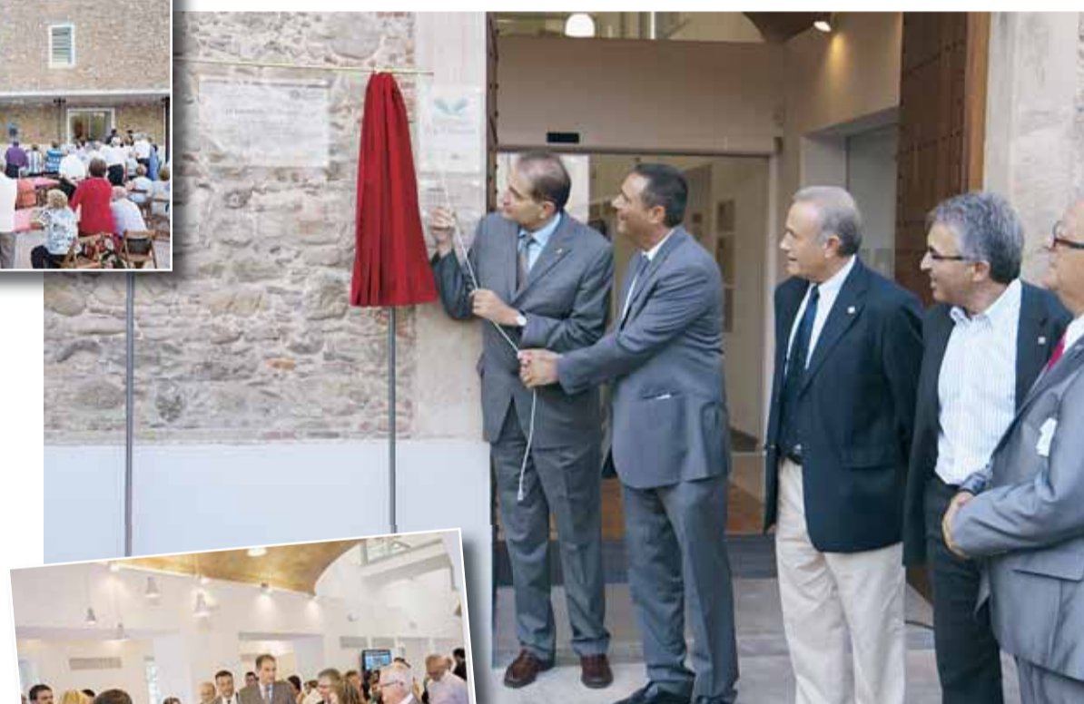
DESCOBRIMENT DE LA PLACA

resta a través de subvencions de la Diputació de Barcelona i la Generalitat de Catalunya.