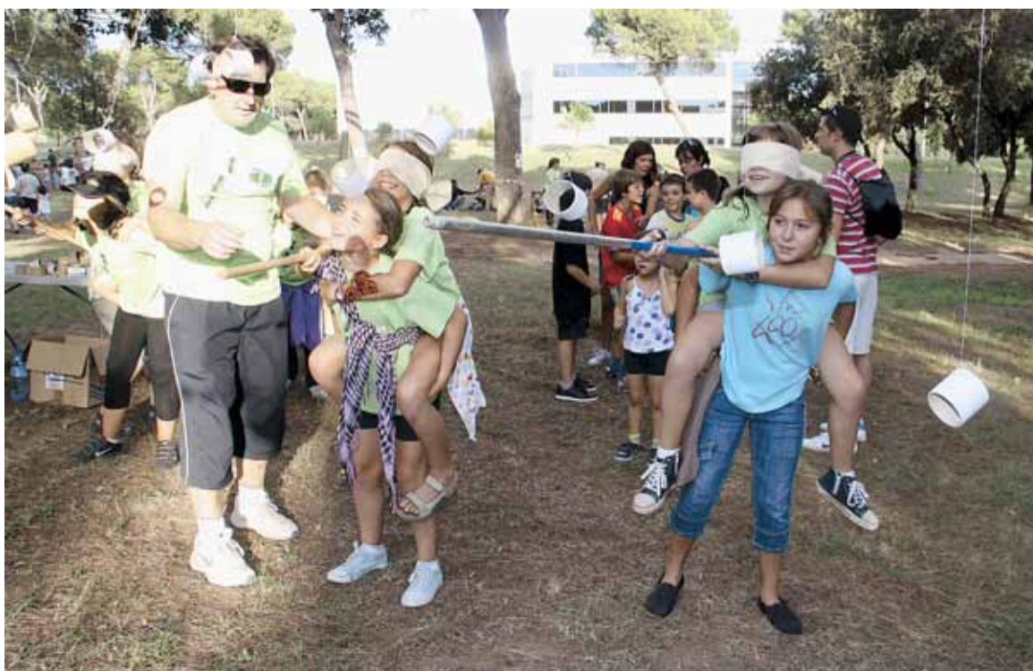
PROVA DEL FORMIGUEIG