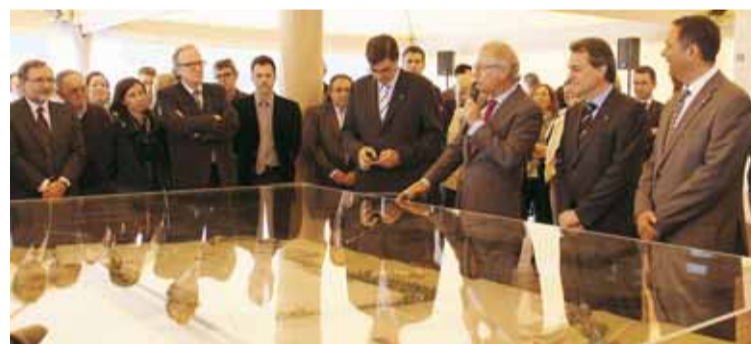
EXPLICACIÓ DEL PROJECTE