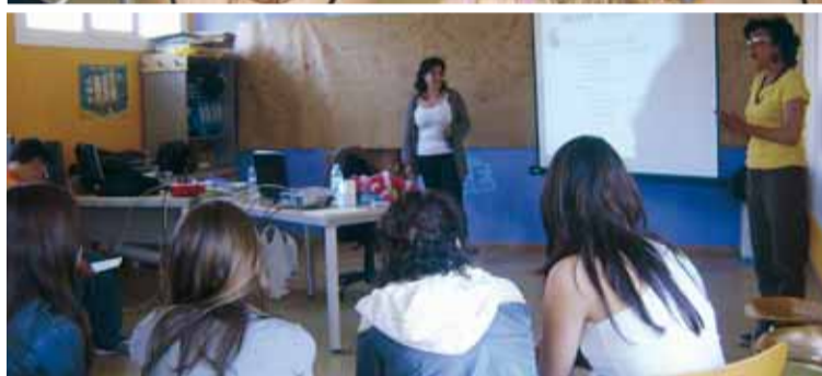
DOS MOMENTS DEL TALLER