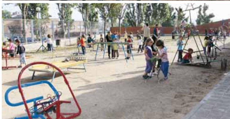
ALUMNES DE P4 DE L'ESCOLA PAISOS CATALANS DURANT EL TALLER