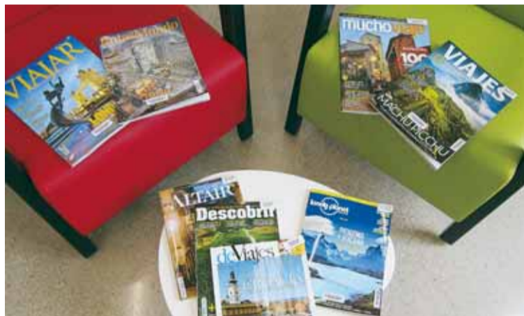
REVISTES DE VIATGES

viaje , Rutas del mundo , Viajar i Viajes que trobareu junt amb les guies, o bé llegir alguns dels relats de viatges basats en experiències personals.