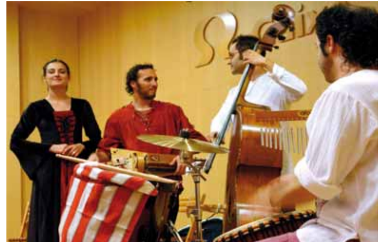
CONCERT DE LA COVA DE PYRENE

construir la seva pròpia titella amb tècniques medievals.*