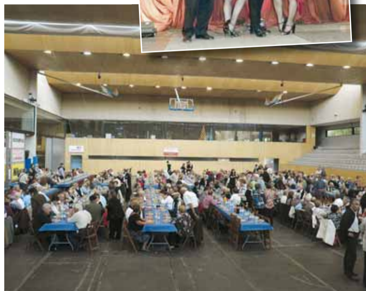
ESPECTACLE I BERENAR

La festa va consistir en un berenar que va tenir lloc el passat 16 d'abril, entre els 17 i les 19 h, al Pavelló Municipal d'Esports. Hi van assistir unes 500 persones. A més del berenar, hi va haver un espectacle amb un humorista i números de cabaret.