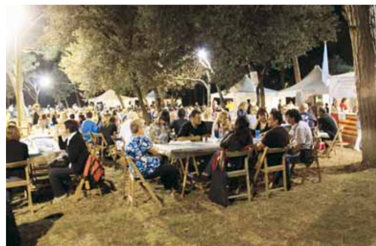
ESPAI BARRAQUES 2010

o bé mitjançant un correu electrònic a cultura@llicamunt.cat