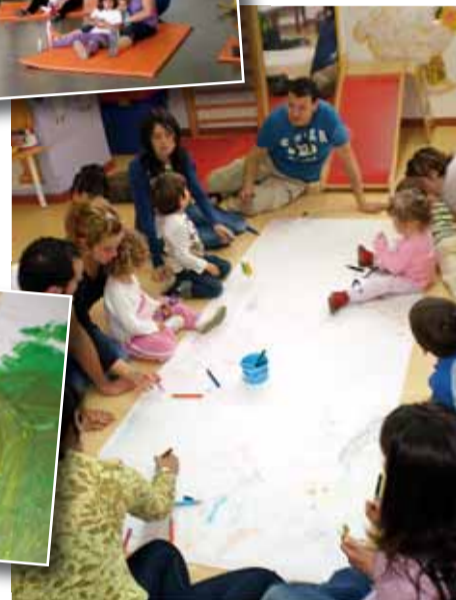
ARTTERÀPIA A PALAUDÀRIES I NOVA ESPURNA