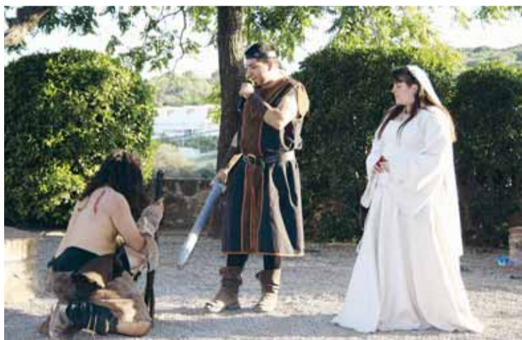
ESPECTACLE DE L'ANY PASSAT