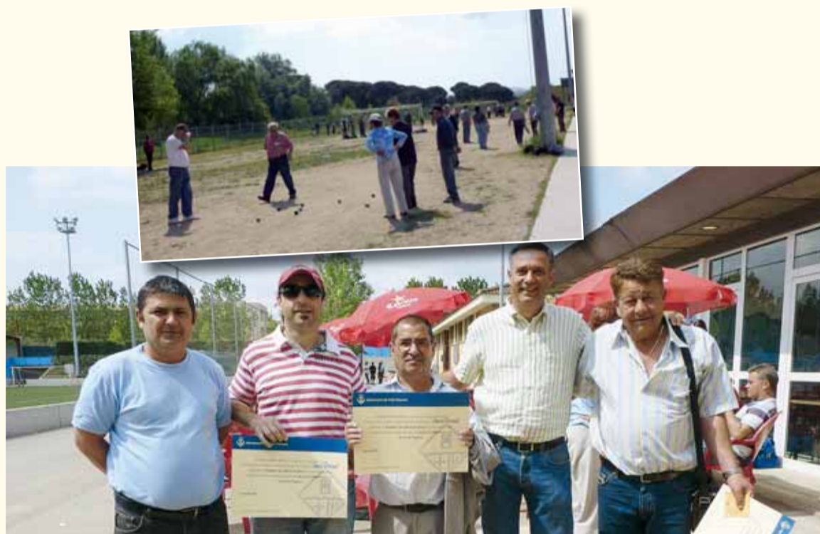
L'ALCALDE I EL REGIDOR D'ESPORTS AMB ELS PREMIATS I MOMENT DEL TORNEIG

Es van donar premis a les 4 primeres tripletes guanyadores del torneig.