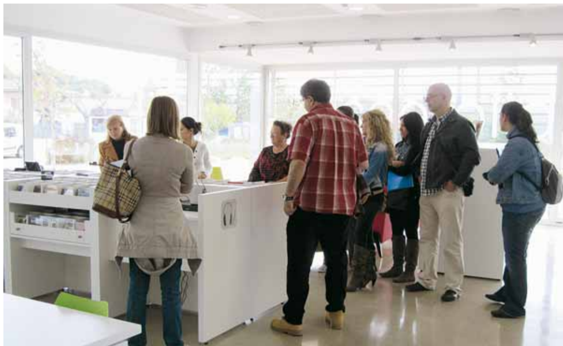
VISITA DEL SEFED

Gran part dels alumnes, alguns procedents d'altres municipis del voltant, no coneixien la biblioteca i van valorar positivament l'activitat.