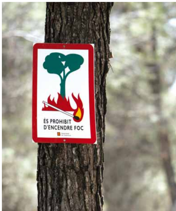
MAXIM RISC FINS AL 15 DE SETEMBRE

La difusió d'un Ban municipal; la realització d'un simulacre de gabinet d'activació de la Guia d'Actuació per emergències d'incendis forestals; el manteniment de totes les franges de protecció contra incendis als barris de les urbanitzacions; el suport al dispositiu local de vigilància i extinció d'incendis, proporcionat per Protecció Civil de Lliçà d'Amunt (dos vehicles, 6-10 efectius, diàriament); el Pla de Vigilància Complementària d'Incendis Forestals, dirigit per la Diputació de Barcelona (ruta diària per Santa Eulàlia, Lliçà d'Amunt, Lliçà de Vall entre el 15 de juny-15 de setembre); el manteniment de camins forestals, amb participació de l'Ajuntament i l'ADF i l'ajut econòmic de la Diputació; el pla de