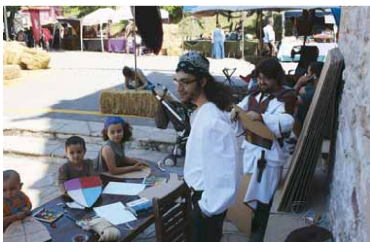
IMATGE DE L'ANY PASSAT

Per a més informació podeu posar-vos en contacte amb la Policia Local trucant al 938607080. Disculpeu les molèsties.