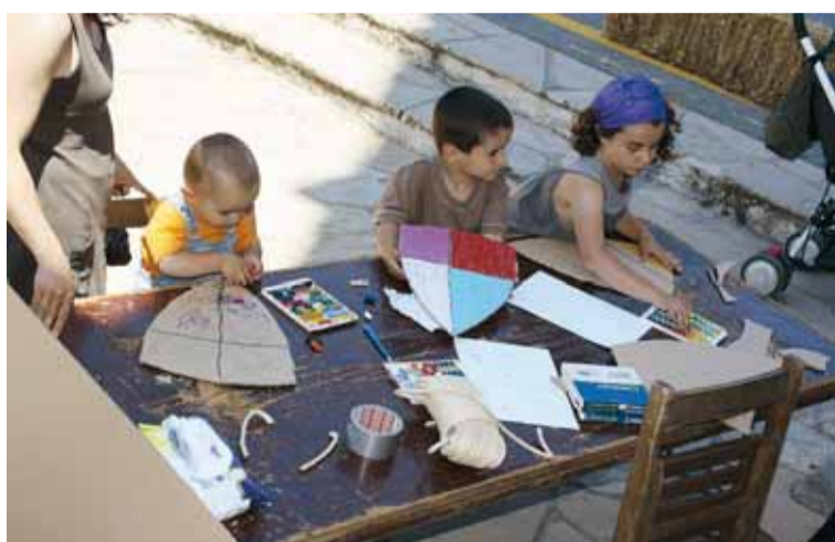
TALLER DE L'ANY PASSAT