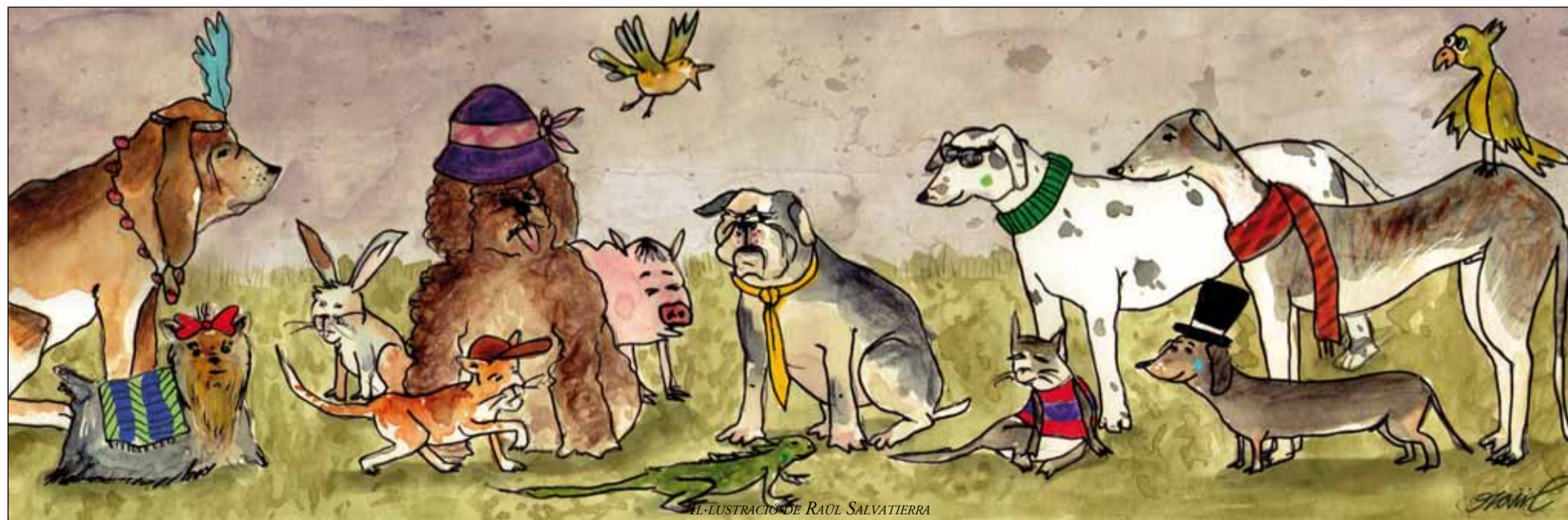
IL·LUSTRACIÓ DE RAÚL SALVATIERRA