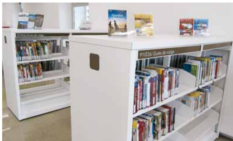
GUIES DE VIATGE

Ara que arriba el bon temps i les vacances s'apropen, la Biblioteca disposa d'un fons d'unes 400 guies de viatges aproximadament on es pot trobar tota la informació necessària del país o de la ciutat que voleu conèixer.