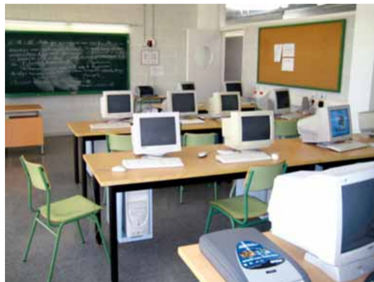
AULA D'INFORMÀTICA DE L'INSTITUT DE LLIÇÀ