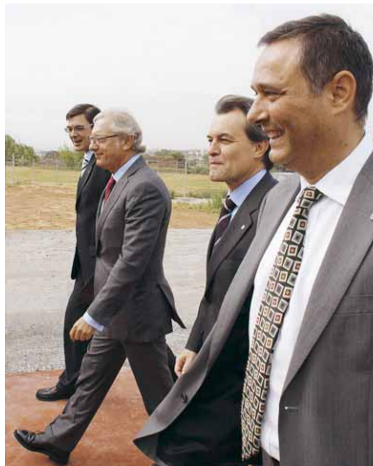
LES AUTORITATS LOCAL I AUTONÒMICA AMB EL PRESIDENT DE L'EMPRESA

L'acte de col·locació de la primera pedra també va comptar amb