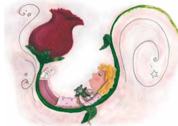
IL·LUSTRACIÓ PARAULES AL BRESSOL

gust per la lectura entre els infants de 0 a 3 anys, tot enfortint els vincles afectius entre pares i fills, a partir del llibre. Actualment, aquest projecte s'ha desenvolupat a diversos països, entre ells Catalunya, on molts municipis ja hi estant adherits. Per a més informació: www.nascutsperllegir.org . Paral·lelament a la xerrada, s'habilitarà un servei de guar-