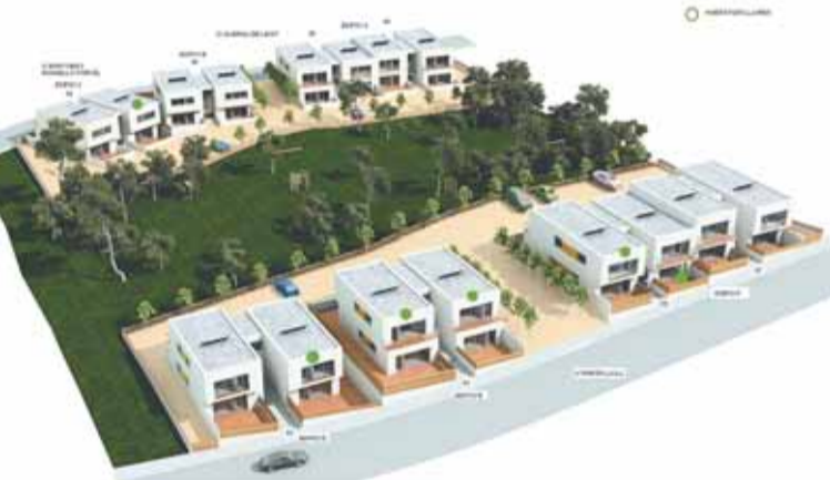
PROJECTE DELS HABITATGES A CAN SALGOT