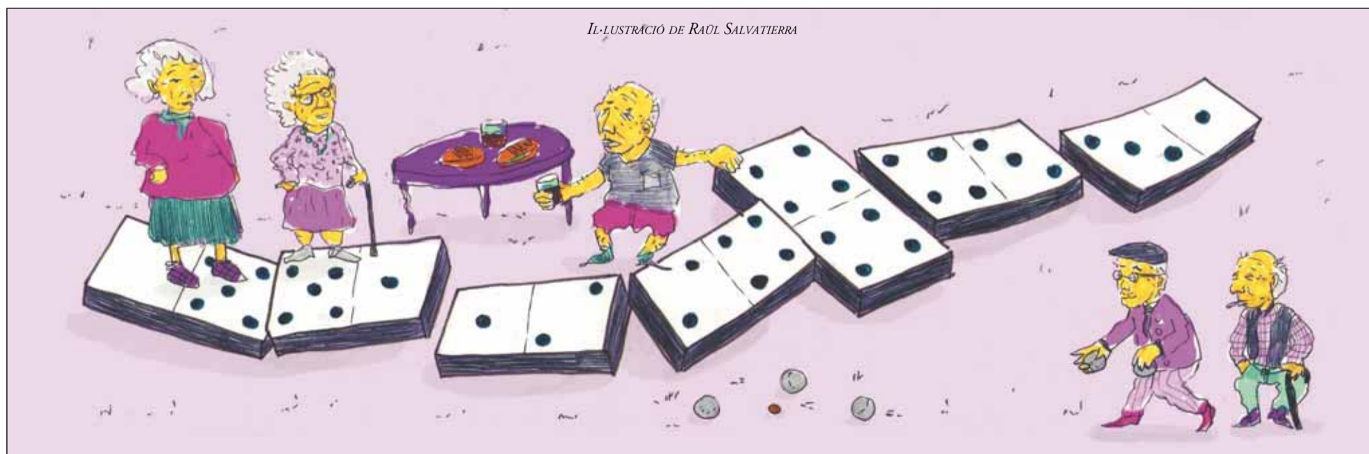
IL·LUSTRACIÓ DE RAÏL SALVATIERRA