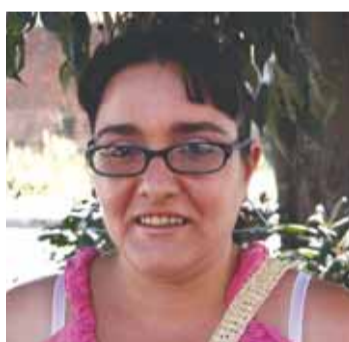
Carlos Tobías Centre urbà

Como hay mucho campo, está muy bien. Esta muy bien para quien quiera mudarse.