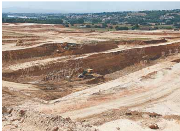
IMATGE DE LES OBRES