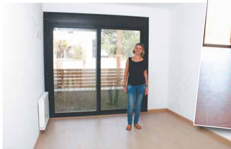
LA CAROL VISITANT EL PIS

gues, on hi ha més habitatges i el supermercat. Del pis li agrada tot i, sobretot, la llum que té. Per ser un pis de protecció oficial, diu que el troba molt maco i força bé. Porta dos anys d'espera i té moltíssimes ganes d'instal·lar-s'hi.