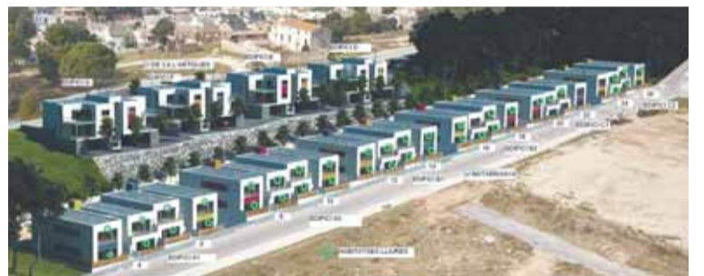
PROJECTE DELS HABITATGES A CA L'ARTIGUES

EL 2007 L'EMO VA REDACTAR EL PROJECTE BÀSIC DE 96 HABITATGES DE PROTECCIÓ OFICIAL