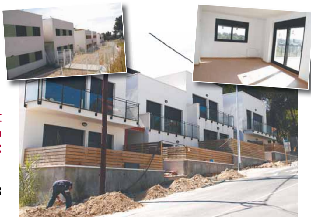
HABITATGES DE PROTECCIÓ OFICIAL

TRANSPORTS I SERVEIS POU PADRÓS. S.L. c/ Baronia de Montbui, nº 20 - 08186 Lliçà d'Amunt (Barcelona) Contacta'ns a tspoupadros@gmail.com o al 93 841 68 91 Ens agrada el que fem