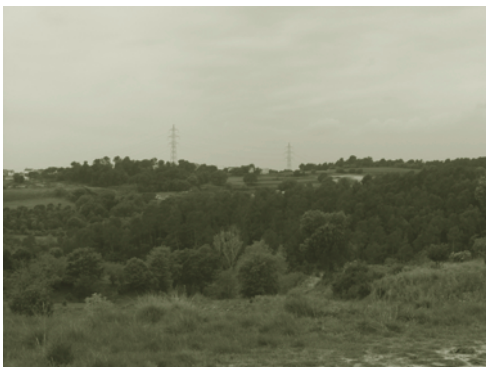
Terrenys entre Ca l'Artigues i Can Farell

El consistori de Lliçà està governat per unes forces polítiques que van signar l'acord del Tinell el qual implícitament no recull aquesta infraestructura, com és prou conegut de tothom, mentre sí que demana "revisar les carreteres de comunicació entre les ciutats del segon cinturó metropolità". I aquesta és la posició de l'Ajuntament.