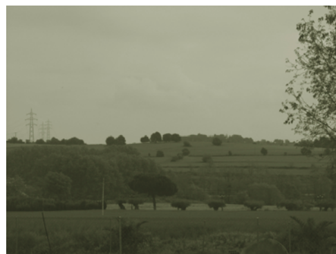
Terrenys de Ca l'Amell