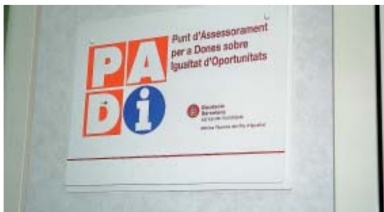
PUNT D'ASSESSORAMENT PER A DONES SOBRE IGUALTAT D'OPORTUNITATS

Recordem que el Punt d'Assessorament per a Dones sobre Igualtat d'oportunitats (PADI), adscrit a la Regidoria de Gent Gran i Benestar i Família, posarà en funcionament un grup de suport terapèutic per a dones diagnosticades de dolor