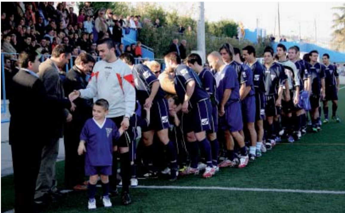
L'ALCALDE I EL REGIDOR D'ESPORTS SALUDANT ELS FUTBOLISTES

El Club Esportiu Lliçà d'Amunt va presentar oficialment tots els seus equips, el 25 de novembre passat, al