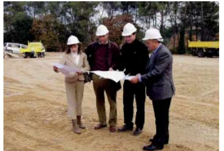
L'ALCALDE I ELS REGIDORS D'INFRAESTRUCTURES I EQUIPAMENTS, I OBRES I SERVEIS

Es preveu que les obres durin unes 6 setmanes amb un cost aproximat de 250.000,00 euros, dels quals 148.000,00 seran aportats per l'Agència de Residus de Catalunya, organisme adscrit al Departament de Medi Ambient de la Generalitat de Catalunya.