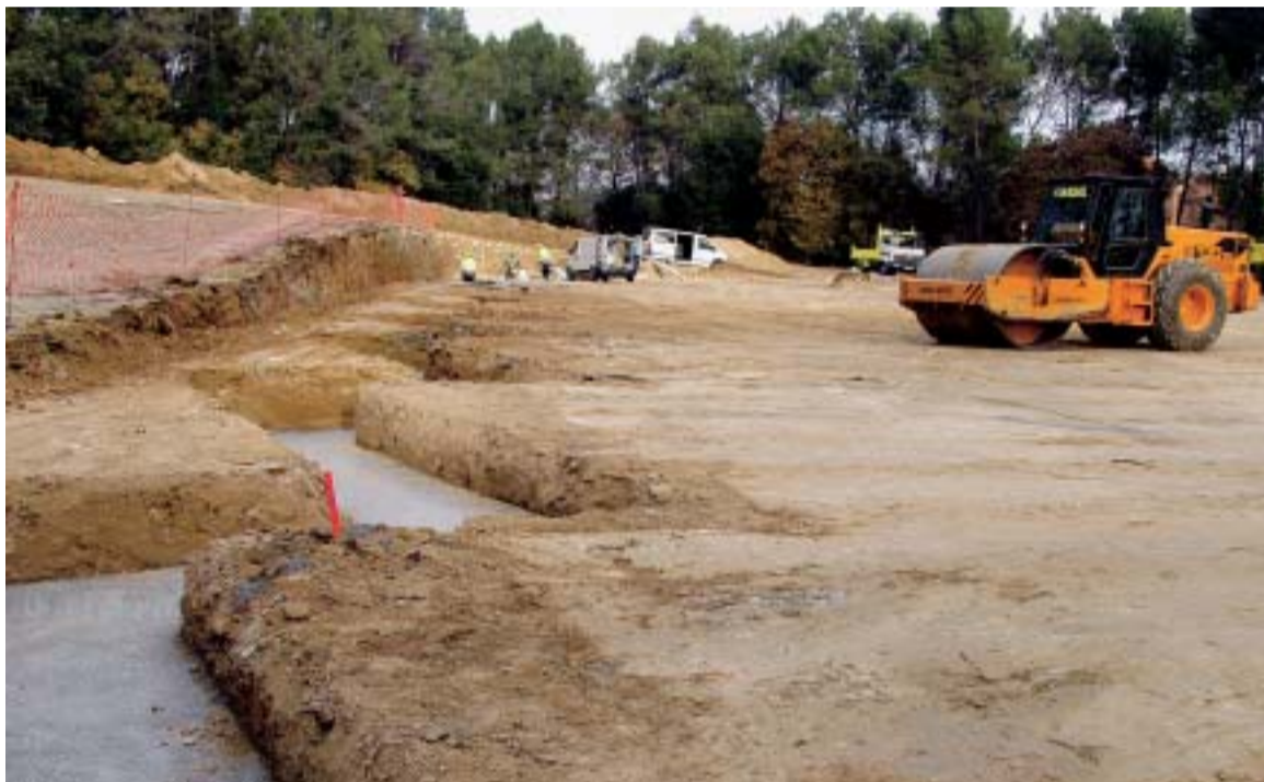
CONSTRUCCIÓ DE LA SEGONA DEIXALLERIA

Les obres de construcció de la segona deixalleria del municipi, a Palaudàries, van començar el 23 de novembre passat. Aquesta instal·lació de recollida selectiva complementarà la que ja funciona al centre des de l'any 1999 i donarà servei a tot el sector occidental del municipi: els barris de Can Salgot, Mas Bo, Can Lledó, Can Roure, Palaudalba, Can Rovira Nou i Can Rovira Vell, amb un volum total de població d'uns 5.000 habitants.