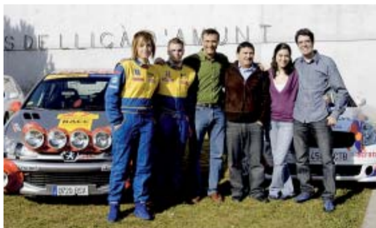
ELS PILOTS DE RAL-LI AMB L'ALCALDE I EL REGIDOR D'ESPORTS