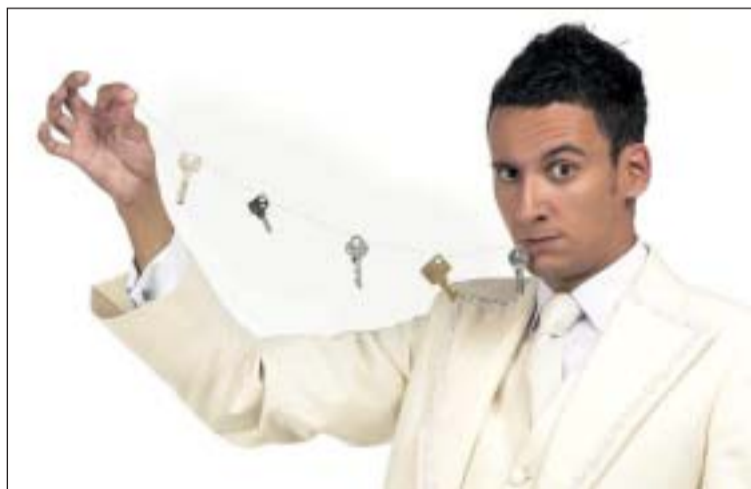
"SECRETS" AMB EL MAG LARI