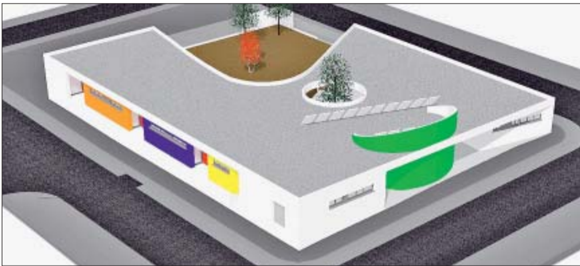
IMATGE DEL NOU EQUIPAMENT ESCOLAR MUNICIPAL

L'Ajuntament, a través de l'Empresa Municipal d'Obres (EMO), va treure a concurs, el novembre passat, l'execució de les obres del nou edifici de l'escola bressol municipal L'Espurna situada a la plaça del Consell de Cent, entre els carrers de Llívia, Prat de la Riba i Folch i Torres. El preu de licitació era de 1.062.216,38 euros més IVA.