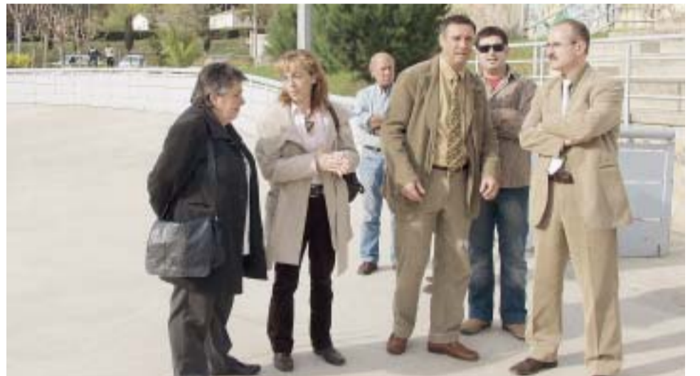
VISITA AL PATINÒDROM

Concretament, l'Alcalde va plantejar al Diputat les següents prioritats d'inversió per al Camp de Futbol Municipal: la construcció de dues pistes de futbol 7 annexes al camp gran, el cobriment de la pista poliesportiva, l'enllumenat i la col·locació de seients a les grades. En referència al Patinòdrom, l'Ajuntament té