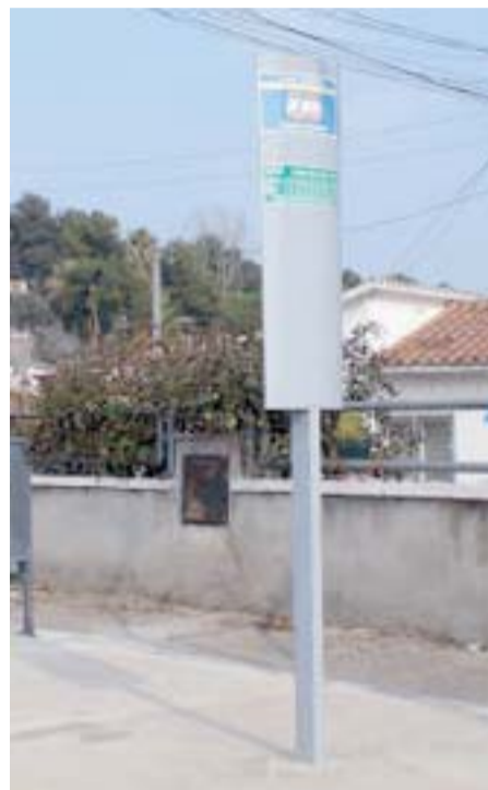
PAL DE PARADA D'ABANS

de les parades, de manera que només i consta l'horari de pas de la parada, cosa que simplifica la consulta a l'usuari. Al mateix temps, s'incorpora un esquema de la línia, en forma de termòmetre, que amplia la informació. A més, s'unifica el disseny de tota la informació, tant de les parades com del tríptic de mà i de la informació a l'interior dels autobusos. Aquestes actuacions propicien que el servei d'autobusos urbans de Lliçà d'Amunt obtingui resultats molt superiors a municipis de similars característiques al nostre. La mitjana de passatgers transportats dels municipis d'entre 10.000 i 20.000 habitants està situada en uns 5 desplaçaments per habitant i any, mentre que la de Lliçà d'Amunt és de 14,3 desplaçaments per habitant i any.