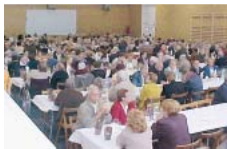
DARRERA FESTA DE PRIMAVERA

Després de quatre anys, l'Ajuntament recupera la Festa de Primavera d'Homenatge a la Vellesa, que pretén aplegar al voltant d'un berenar totes les persones a partir de 70 anys i empadronades al municipi. La festa s'organitza conjuntament amb la Comissió d'Homenatge a la Vellesa.