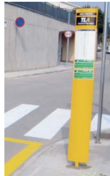
PAL DE PARADA ACTUAL