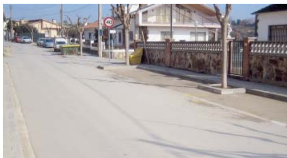
VIAL ANETO ABANS