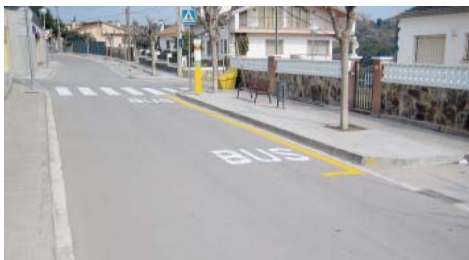
VIAL ANETO ARA