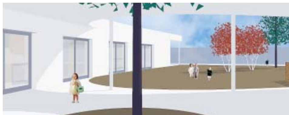
IMATGE VIRTUAL DE L'ESCOLA BRESSOL

amb un pressupost d'execució per contracte de 1.232.171,01 euros (IVA inclòs) i un termini previst d'execució de 7 mesos. Hi ha una subvenció demanada i concedida de 575.000 euros i la previsió de crèdit inicial per fer front als treballs previstos està garantida.