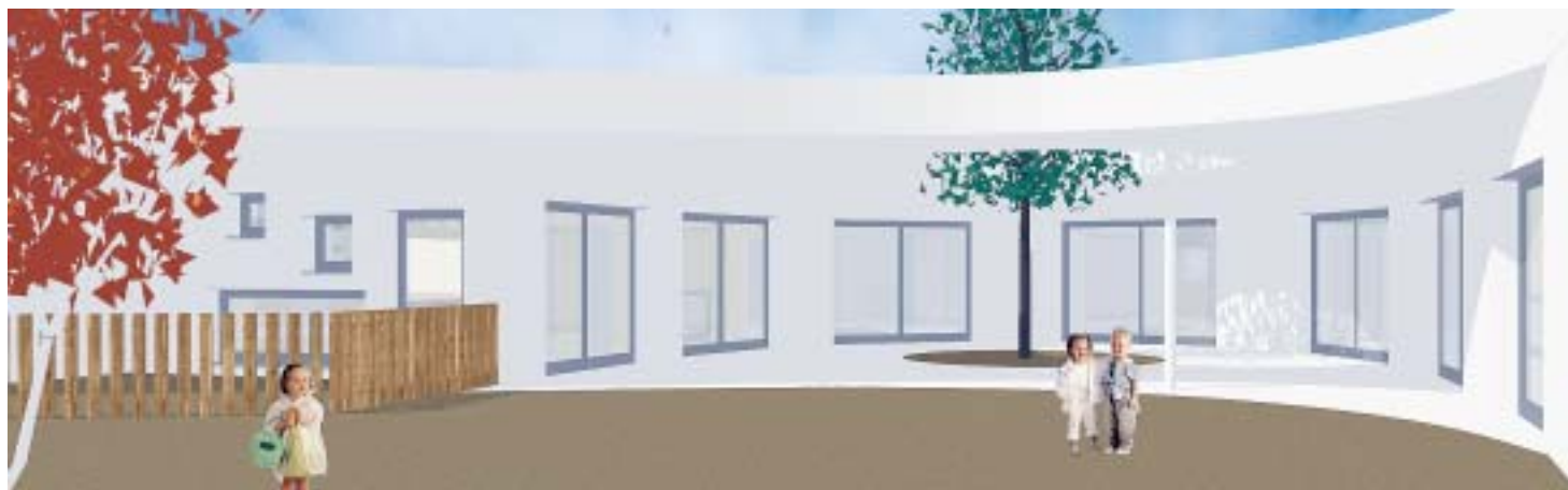
IMATGE VIRTUAL DE L'ESCOLA BRESSOL

La primera escola bressol de Lliçà, d'iniciativa municipal, creada ara fa 30 anys: l'Escola Bressol L'Espurna, estrenarà nou edifici el proper curs escolar 2008-09. Aquesta és una de les principals novetats del curs escolar que comença aquest setembre.