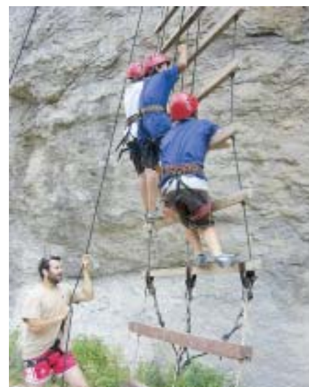
ALGUNES DE LES ACTIVITATS ESPORTIVES PER ALS NENS