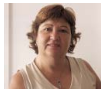
Josep Pou Centre urbà

Yo, desde el año pasado, participo en el Sopar de les Àvies y me gusta mucho. Aparte de este acto, en los otros no participo, porque son para gente más joven, pero sí que voy a verlos: el baile, las gitanas, las pruebas de la Juguesca. Hace unos ocho años que vivimos aquí, vinimos de Granollers y, después de la Fiesta Mayor de allí, nos paseamos por esta. Nos gusta mucho.