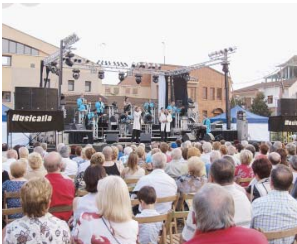
MUSICALIA A LA FESTA MAJOR