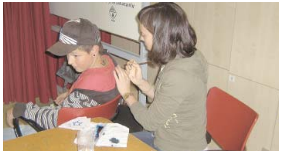
TATOOS AMB TINTA XINESA A L'URBAN JAM