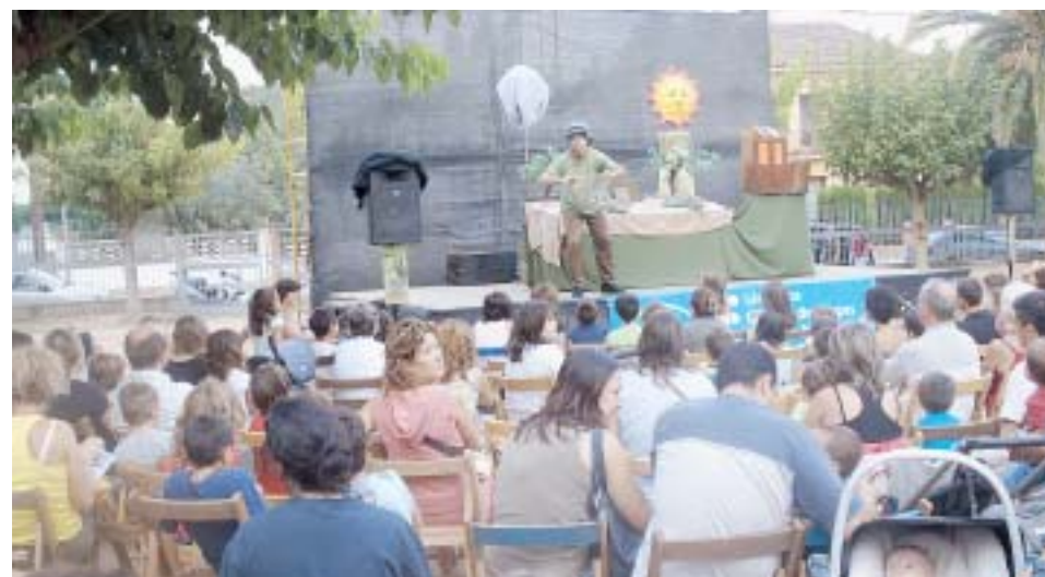
ESPECTACLE PER A NENS I NENES