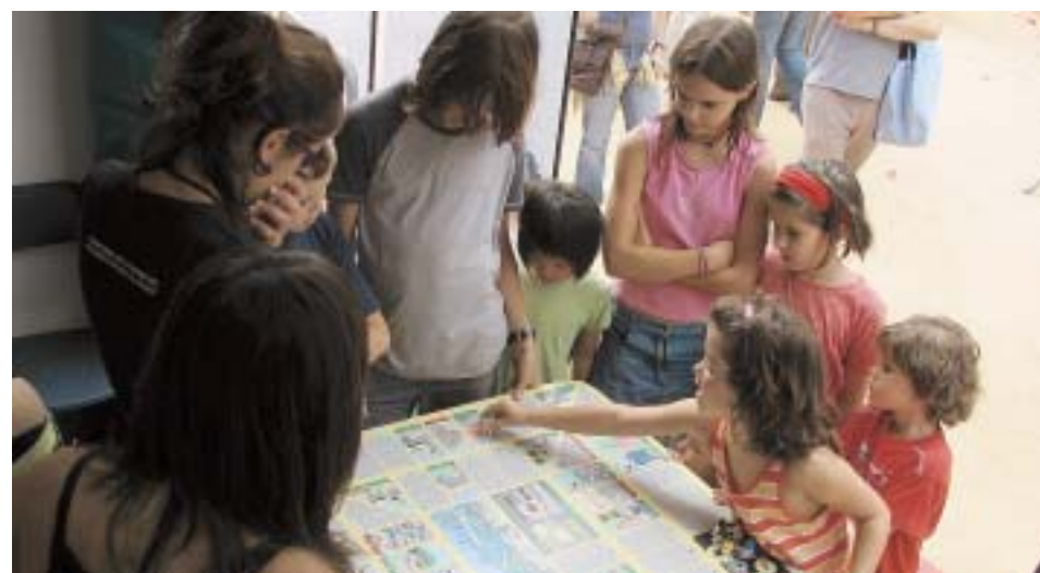
EL NENS I NENES S'HO PASSEN D'ALLÒ MÉS BÉ

La SMSS vol respondre a la constatació que, a tota Europa, els ciutadans i les ciutats estan preocupats pel malestar causat pel tràfic motoritzat: contaminació de l'aire, contaminació acústica, aglomeracions, etc. Però malgrat aquesta preocupació general, el nombre de cotxes segueix creixent. Així, el propòsit de la SMSS és propiciar que els ciutadans europeus esdevinguin conscients que per combatre la contaminació i malestar causats per l'augment de cotxes i motos s'ha d'actuar individualment i a nivell de ciutat o poble, apostant per vies de transport alternatives. Es proposen diferents tipus d'accions: encoratjar l'ús de formes de transport alternatives al cotxe; fer créixer la consciència dels ciutadans sobre els riscos associats a la contaminació i la importància del model de mobilitat; l'acció tradicional de restringir el trànsit a determinades àrees, i també és un moment en què les ciutats i ajuntaments aprofiten per donar a conèixer als ciutadans quines accions s'estan duent a terme des de les institucions públiques a favor d'un model de mobilitat sostenible i segura. El propòsit general és, doncs, que individualment i col·lectivament ens fem conscients i promovem un model de mobilitat que a mig i llarg termini ens ajudi a gaudir de ciutats i pobles més tranquils i sense contaminació.