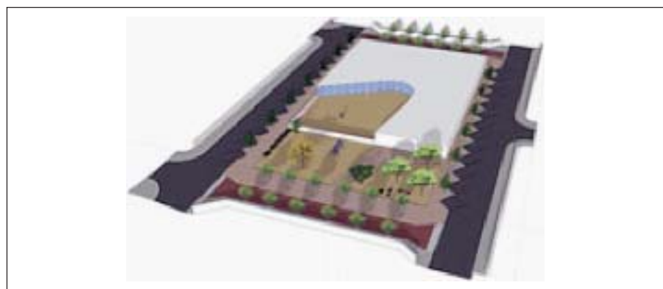
IMATGE VIRTUAL DEL PROJECTE

Els treballs de reurbanització de la plaça Consell de Cent, que responen a les necessitats sorgides arran de la construcció de la nova escola bressol, que entrarà en funcionament el proper setembre, van començar el 21 de juliol passat.