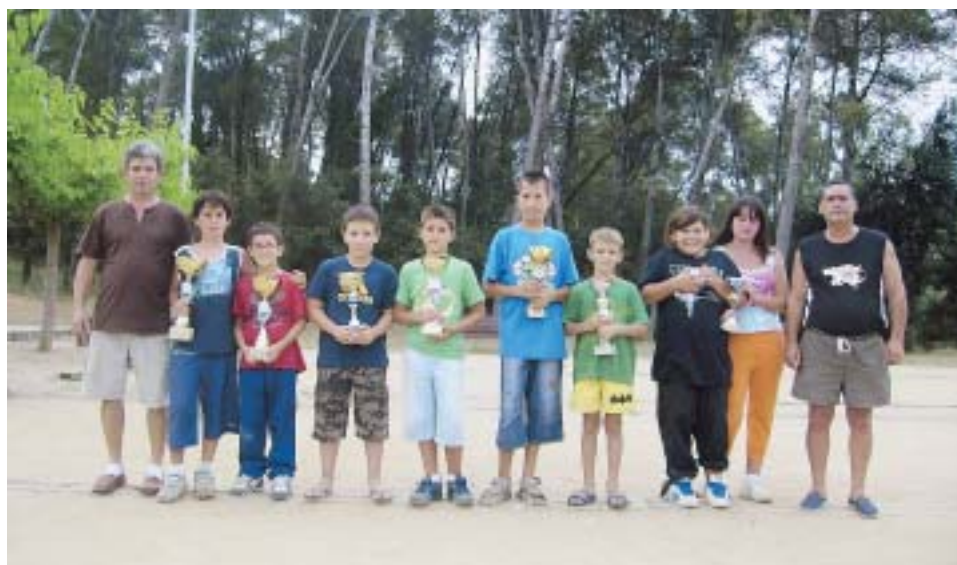
ELS GUANYADORS AMB EL PRESIDENT I EL SECRETARI DEL CLUB PETANCA MAS BO