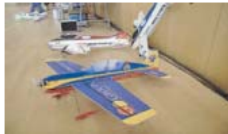
AVIONS D'AEROMODELISME INDOOR

El passat 12 de juliol es va celebrar, al Pavelló Municipal d'Esports de Lliçà d'Amunt, la Competició F3P Acrobàcia indoor, una prova vàlida per al Campionat de Catalunya d'aeromodelisme indoor. Aquest acte va estar organitzat per l'Aeroclub R/C de la Vall del Tenes amb la col·laboració de l'Ajuntament de Lliçà d'Amunt.