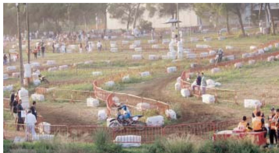
CIRCUIT DE LES 24 HORES DE RESISTENCIA