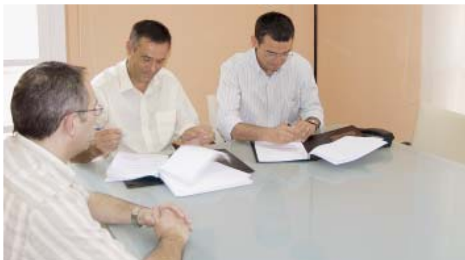
SIGNATURA DEL CONVENI

El centre de rehabilitació, ubicat en una part del local del carrer de l'Aliança, número 7, prestarà els serveis de rehabilitació ambulatoria, rehabilitació domiciliària i logopèdia. La gestió és concertada amb el Servei Català de la Salut de la Generalitat de Catalunya. Aquest centre donarà servei a uns 250 pacients mensualment, però es podria arribar fins a 300 pacients, més de la meitat dels quals es calcula que seran de Lliçà d'Amunt. La inauguració i l'inici de l'activitat estan previstes pel primer trimestre del 2009.