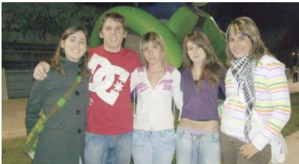
UN GRUP D'AMICS A L'ONA JOVE

Com a valoració global de les nits, la regidoria de Joventut explica que hi va haver molta participació tant de joves com de gent d'altres franges d'edat, encara que, als centres cívics de les urbanitzacions l'assistència va ser fluixa en comparació de la resta. Segons les opinions dels i les joves, al estar lluny de la centralitat del poble i sense disponibilitat de transport, era difícil accedir a aquests llocs i més per la nit. Tot i que el projecte ha estat molt satisfactori, la regidoria de Joventut comenta que es tindrà en compte aquest aspecte de cara a l'any que ve i s'intentarà millorar.