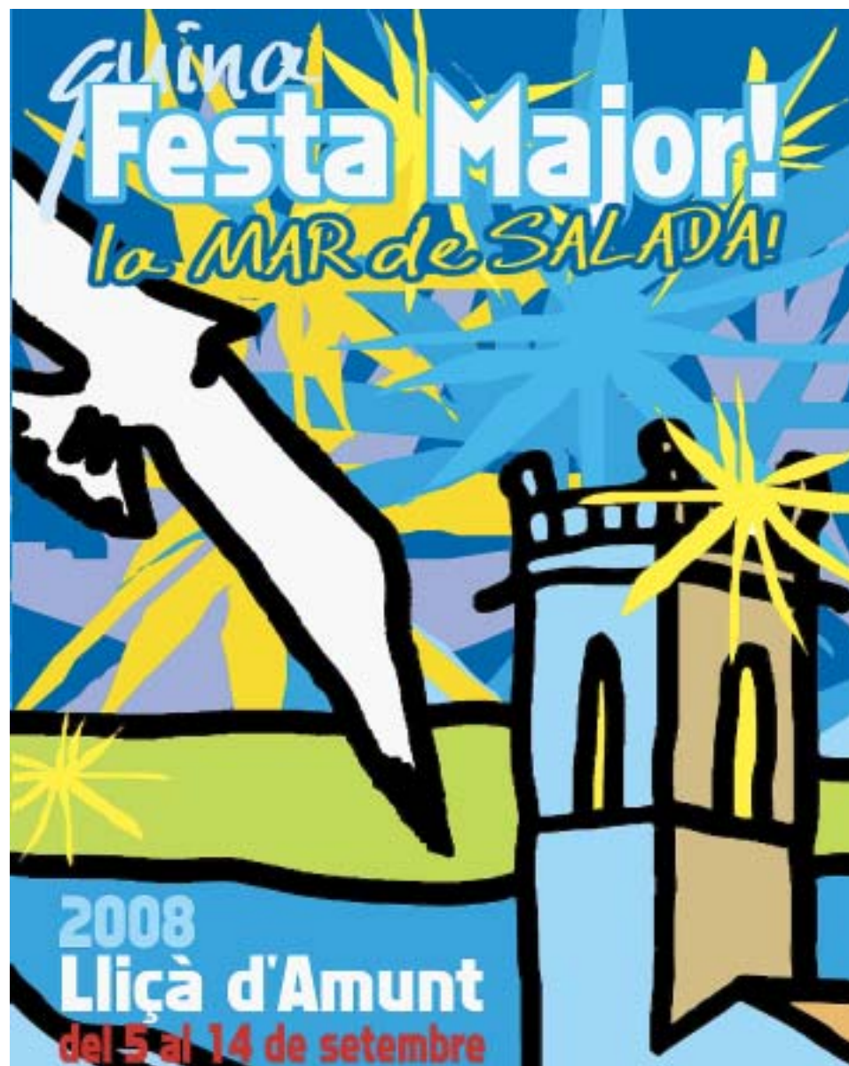
PORTADA DEL PROGRAMA DE LA FESTA MAJOR

Per a més informació, podeu posar-vos en contacte amb la regidoria de Cultura, trucant al 93 841 52 25 o bé mitjançant el correu electrònic cultura@llicamunt.cat . També podeu visitar el web municipal www.llicamunt.cat .