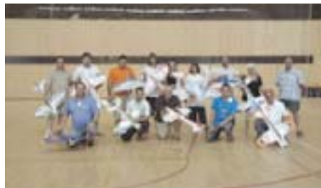
PARTICIPANTS DE LA PROVA