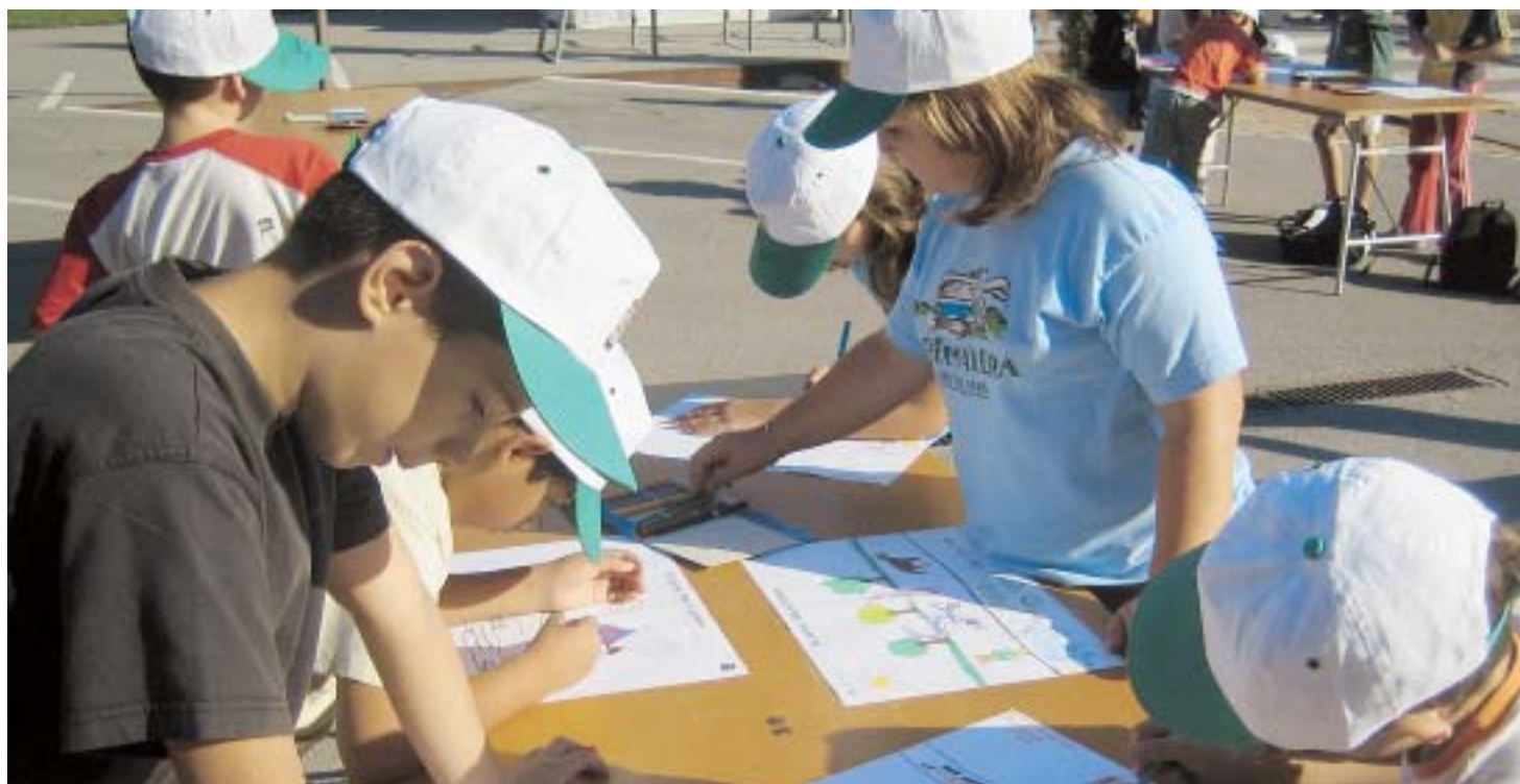
AL CARRER, TOTS HI PINTEM

L'edició d'enguany de la Setmana de la Mobilitat Sostenible i Segura tindrà lloc del 22 al 29 de setembre.