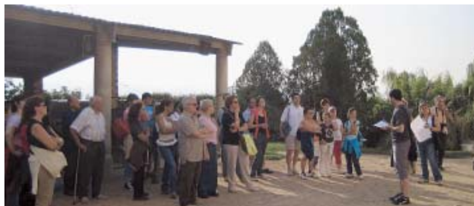
JORNADAS EUROPEAS DEL PATRIMONI

La regidoria de Cultura ha organitzat una recorregut a peu guiat per visitar les masies de Ca l'Esteper, Can Pasqual i Can Salgot dins de l'edició d'enguany de les Jornades Europees del Patrimoni.