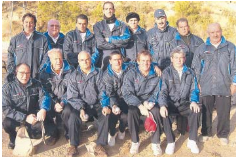
MEMBRES DEL CLUB DE PETANCA

d'ara, ha passat a anomenar-se Lliçà Club Petanca. D'aquesta manera, representarà i portarà el nom del nostre poble a la propera lliga de petanca federada.