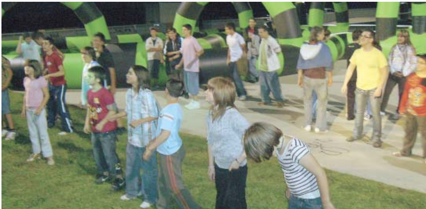
ACTIVITATS DE GRUP A L'ONA JOVE

A Lliçà d'Amunt tots els estius es duu a terme un projecte d'oci nocturn alternatiu per als i les joves (ONA JOVE), que sorgeix de l'escassetat d'activitats de lleure a la nit en aquest poble i la necessitat de descentralització de les mateixes, ja que es va detectar que quasi totes les activitats que es realitzaven a Lliçà d'Amunt es duien a terme al centre, i la població de les urbanitzacions tenia difícil accés degut a la inexistència de transport nocturn interurbà.