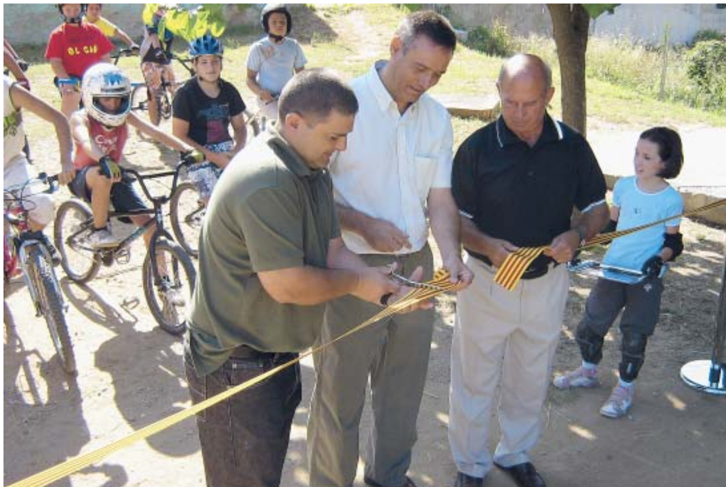
INAUGURACIÓ OFICIAL DEL CIRCUIT DE BMX

L'acte d'inauguració del nou local social i del circuit per a bicicletes de cros del barri de Ca l'Esteper va tenir lloc el 19 de juliol passat.