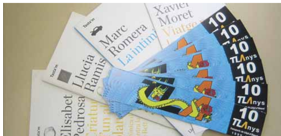
10 TLAnys Sant Jordi 09

Durant el dia de Sant Jordi, es va obsequiar tots els usuaris del transport urbà amb un punt de llibre i un exemplar dels Tastam, pertanyent a la campanya "Llegir ens fa + lliures", impulsada pel Departament de Cultura de la Generalitat i l'Autoritat del Transport Metropolità.