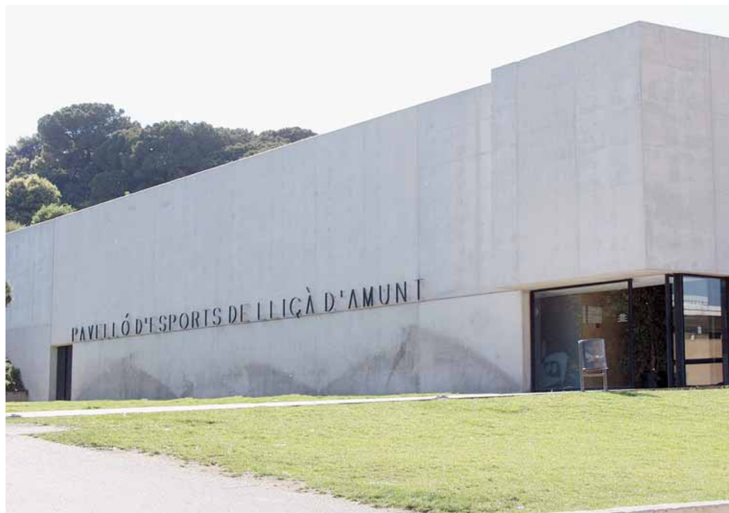
PAVEL·LÓ MUNICIPAL D'ESPORTS

Des de principis d'any, l'Ajuntament es va posar en contacte amb la Federació Catalana de Bàsquetbol per tal de ser la seu de la final del Campionat de Catalunya de Bàsquet de la categoria júnior masculí de primer any, ja que l'equip lliçanenc d'aquesta categoria estava fent una lliga regular molt bona i amb possibilitats d'arribar a la final. Així doncs, un cop aconseguit arribar a la "final four", l'equip júnior masculí de primer any del C.B. Lliçà d'Amunt es jugarà a casa el Campionat de Catalunya.