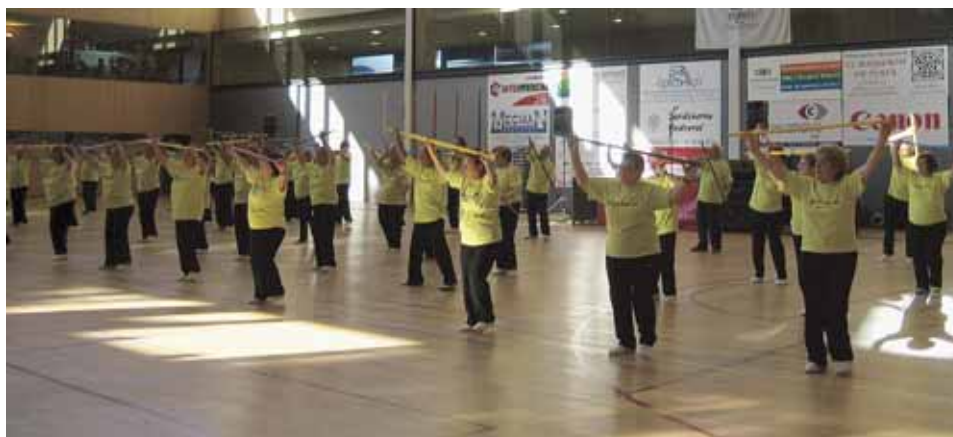
FESTIVAL DE L'ANY PASSAT