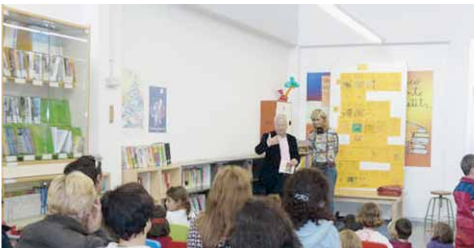
7è ANIVERSARI DEL RACÓ DEL CONTE

El Racó del Conte consisteix en l'explicació de contes infantils a càrrec d'alguna persona adulta. Està obert a tots els nens i nenes del poble i les seves famílies. Mensualment, es fa arribar un full amb la informació del Racó del Conte del mes a tots els nens i nenes de P3 fins a 2n de totes les escoles del municipi, així com a les escoles bressol municipals.