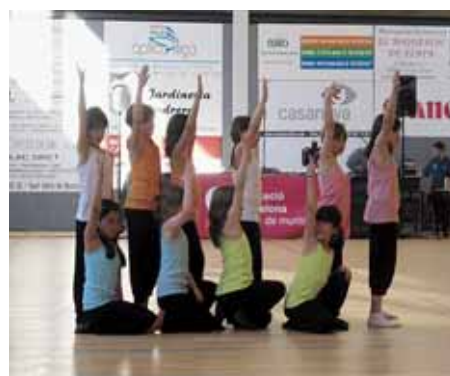
ACTUACIÓ DE L'ANY PASSAT

El Festival de Cloenda d'activitats de l'Escola Esportiva Municipal i de les activitats esportives que s'imparteixen al Gimnàs del Pavelló Municipal d'Esports tindrà lloc el divendres 29 de maig, a les 19 h, al Pavelló Municipal d'Esports. En aquest festival, els esportistes oferiran una exhibició de les activitats que han realitzat durant aquesta temporada esportiva: aeròbic, jazz, batuka, steps, karate, dansa del ventre, chi kung, aikido, etc.