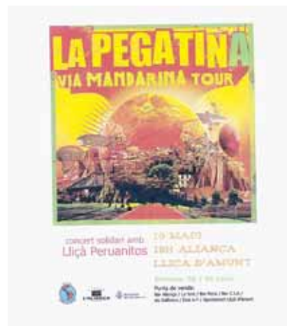
CARTELL DEL GRUP

Lliçà Peruanitos ha organitzat un concert solidari per recollir diners per ajudar als nens i nenes del Perú. El concert tindrà lloc el diumenge 10 de maig, a les 19 h, a l'Ateneu l'Aliança. Anirà a càrrec del grup musical "La Pegatina", format per un grup de joves solidaris que canten rumbes. També hi haurà una exposició fotogràfica sobre els treballs d'aquesta organització solidària de Lliçà d'Amunt. El preu de les entrades és de 5 euros (4 euros per als socis) i els punts de venda: bar L'Aliança, bar La Font, bar Paris, bar C.I.A., Els Galliners, Disk K-7 i l'ajuntament.