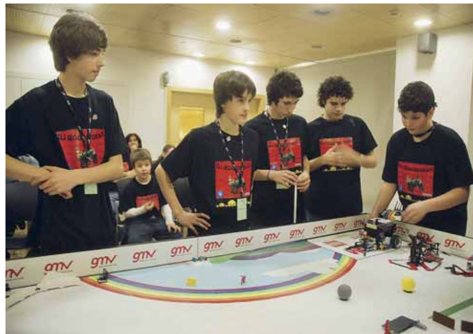
EL GRUP COMPETINT

tecnologies diverses. I, ara, la il·lusió de tots els components és la assistència a aquest esdeveniment europeu i poder seguir demostrant el seu entusiasme i ganes de jugar amb la ciència i la tecnologia, creant bases de coneixement.