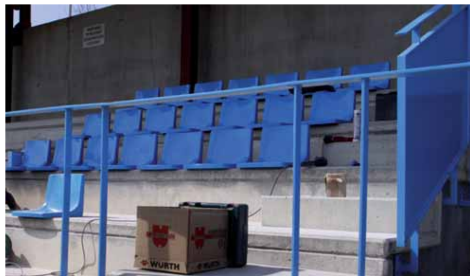
COL·LOCACIÓ DELS SEIENTS A LES GRADES

Amb aquesta actuació finalitza l'adequació de les grades del Camp de Futbol Municipal del Parc Esportiu del Tenes, cosa que esdevé un pas més cap a la millora de les instal·lacions esportives del municipi.