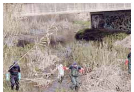
NETEJA DE RESIDUS PEL RIU TENES