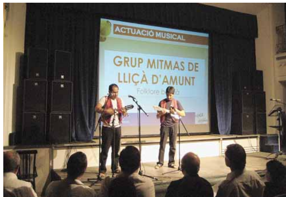
LENGÜES DEL MÓN

d'un espectacle que ens permet escoltar i descobrir la gran diversitat lingüística i cultural existent a Lliçà d'Amunt a través de cançons, contes, dites, músiques, informacions de ciutats o llocs del món, etc.