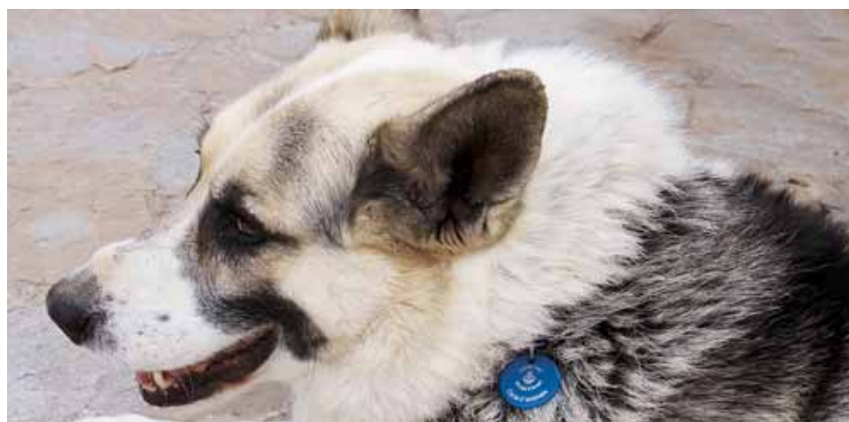
GOS CENSAT AL MUNICIPI

Aquests i altres animals els podreu veure al Centre d'Acollida d'Animals de Companyia del Vallès Oriental, 93 840 27 77, al Polígon Industrial Font del Radium de Granollers i també al web del SPAM www.protectoramataro.org .