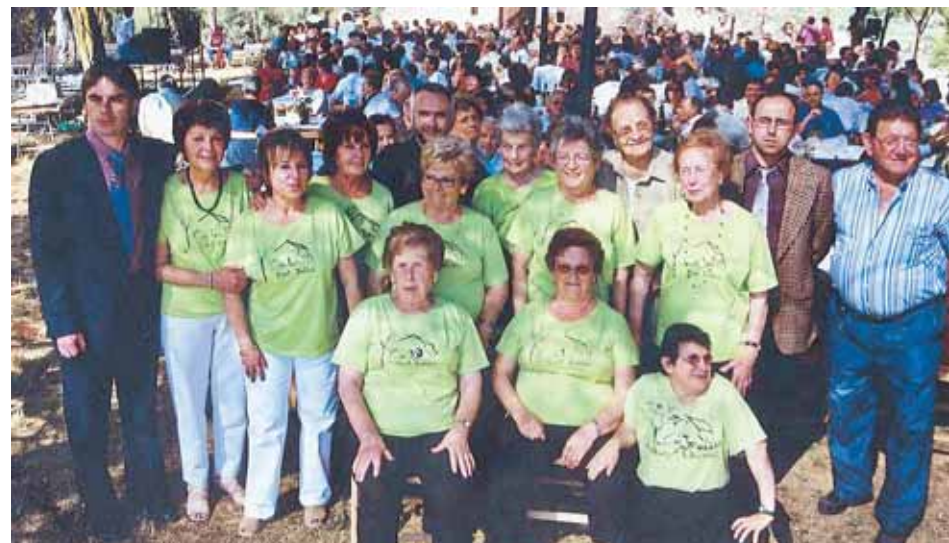
APLEC DE SANT BALDIRI

La programació de l'Aplec d'enguany compta amb una arrossada i un concert, a més de la celebració d'una missa i una cantada de sardanes i havaneres a càrrec del Cor Claverià.