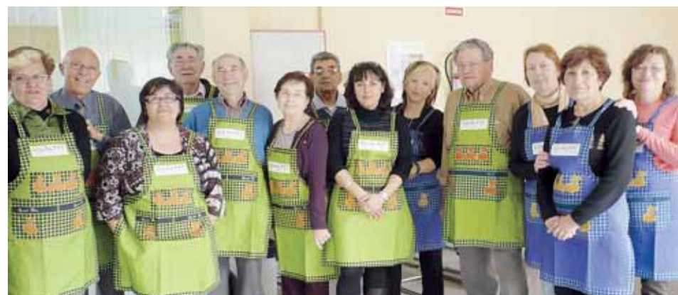
TALLER D'HABILITATS DOMÈSTIQUES I GESTIÓ DE LA LLAR

Aquest taller, impartit per les treballadores familiars de l'Ajuntament, ha comptat amb la participació de l'Associació Dones del Tenes, que ha estat una ajuda important per engrescar els homes a perdre la por a agafar una agulla o planxar una camisa. El Pla d'Igualtat agraeix la seva col·laboració i implicació per aconseguir una societat sense desigualtats pel fet de ser home o dona.