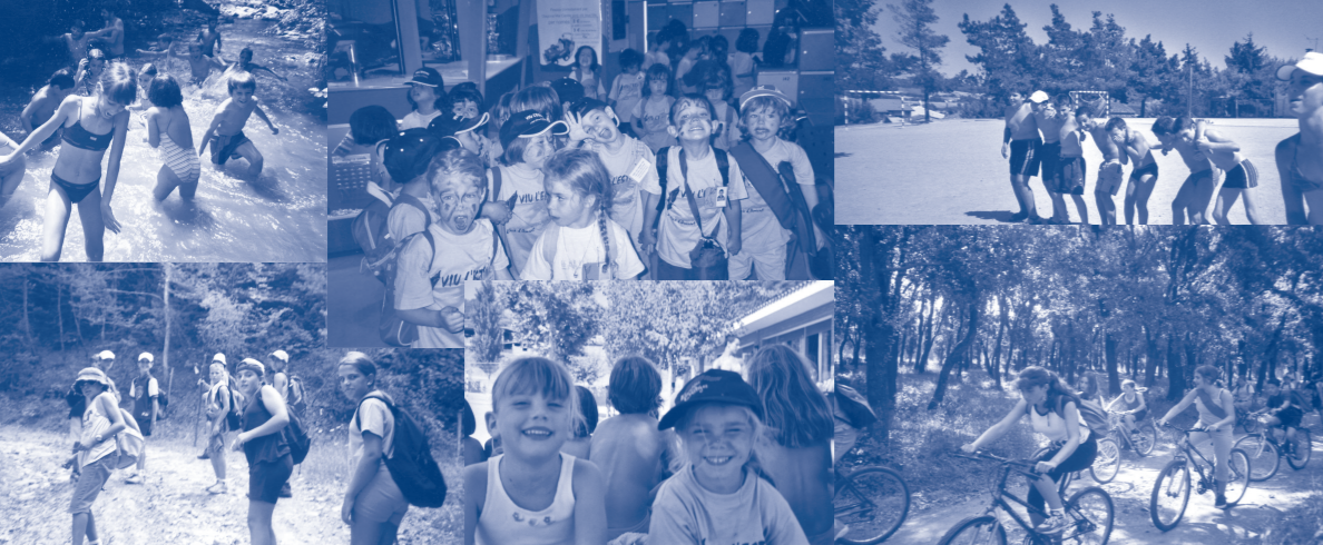
butlletí quinzenal d'informació municipal de l'Ajuntament de Lliçà d'Amunt / 15 de maig de 2004