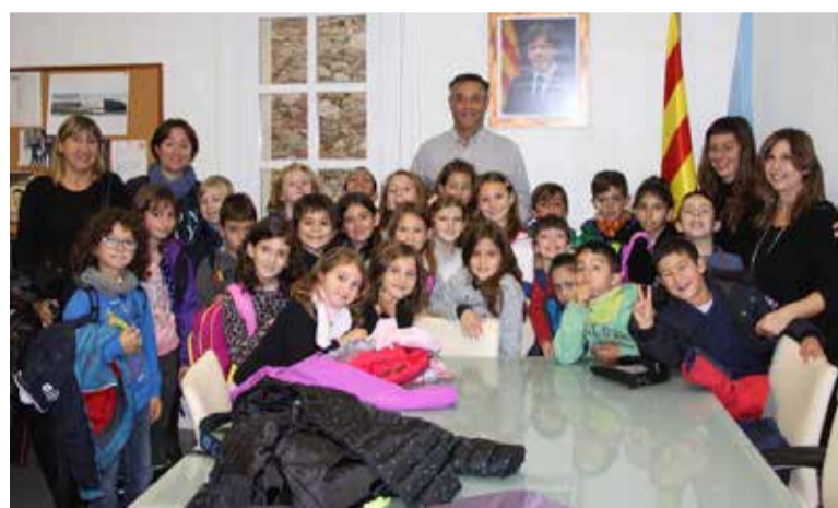
Alumnes de 3r B