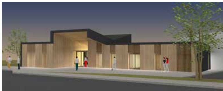
Entrada del Casal de la Gent Gran de Paludàries