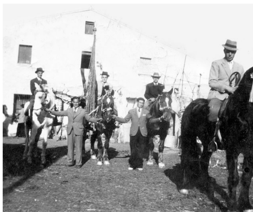
Banderer i cordonistes en un imatge d'abans dels anys trenta

Podeu veure el programa complet de la Festa de Sant Antoni Abat al web municipal. La cavalcada dels Tres Tombs té l'origen en la devoció que traginers i homes de camp tenien a Sant Antoni Abat, un gran amic dels animals que es dedicava a protegir els animals de càrrega i els que es feien servir en les feines del camp, segons la tradició cristiana. El dia de l'onomàstica d'aquest sant, el 17 de gener, es donava festa als animals (bàsicament bestiar de tir o muntura com els cavalls, les mules, els rucs...) i se'ls portava a beneir per tal que no patissin cap mal. De camí cap a l'església, els propietaris exhibien els animals que prèviament havien engalanat per a tal esdeveniment. Originàriament es donaven tres voltes a l'església on s'havien de beneir als animals (tres tombs) i d'aquí ve el nom de la cavalcada.