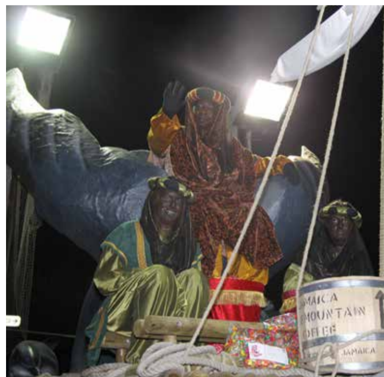
Arribada de Ses Majestats els Reis Mags d'Orient

Abans de sortir al balcó de l'Ajuntament, però, Ses Majestats els Reis Mags d'Orient rebran en audiència privada els 10 nens i nenes d'entre 3 i 8 anys afortunats en el sorteig celebrat el passat 19 de desembre entre tots els que van omplir una butlleta amb aquesta finalitat.