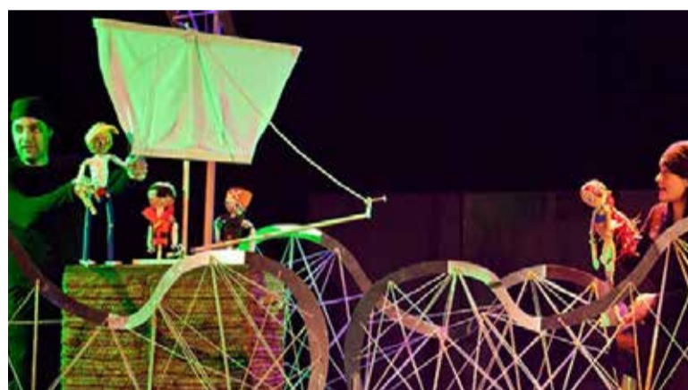
"La sirenetta" de la companyia Festuc Teatre.

La història comença en el fons del més blau dels oceans. Existia una ciutat de nacre i coral on vivia el rei Tritó amb les seves filles; entre totes, la petita era la més bella i tenia la veu més preciosa de tot l'oceà, el seu nom era Mar, però tots la coneixien com La Sirenetta. Ni la immensitat dels mars és capaç que la nostra protagonista se senti atrapada en un aquari, enamorada del món exterior i d'un bell