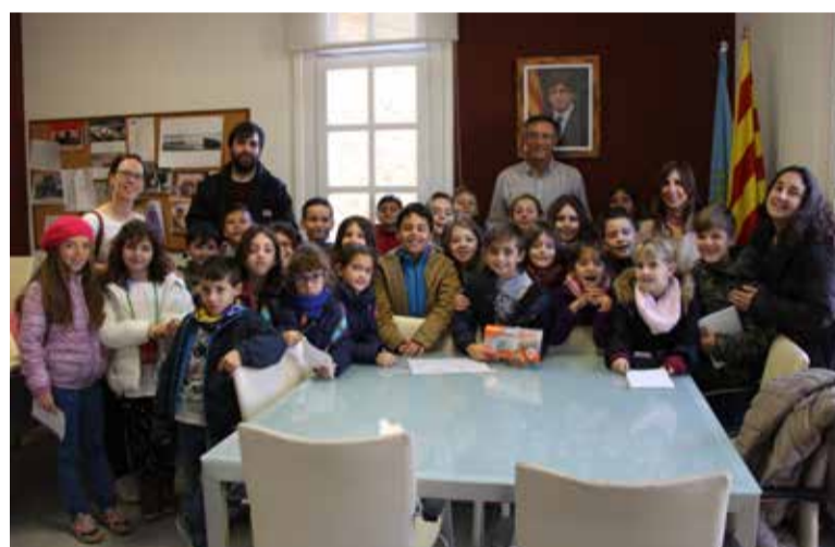
Alumnes de 3r A

Els alumnes de 3r de Primària de l'escola Rosa Oriol i Anguera van visitar l'Ajuntament el passat mes de novembre dins del marc de l'activitat "Conèixer l'Ajuntament", inclosa en el PAE (Programa d'Activitats Educatives) que l'administració local ofereix