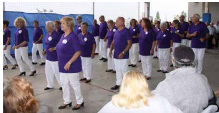
Festa d'Homenatge a la Vellesa.