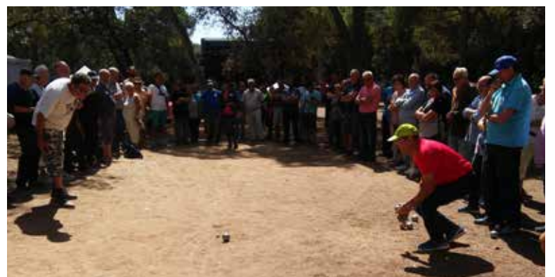
Melé de botxes.