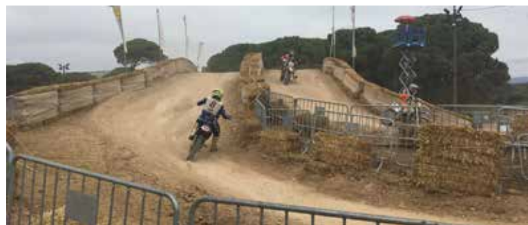
Moment de la cursa.