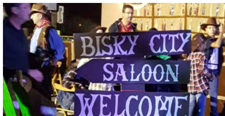
La Juguesca: Far far west.