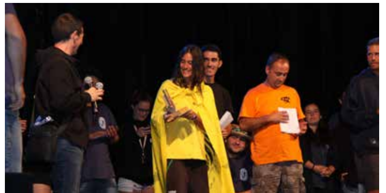
La Juguesca: Veredict de La Juguesca.

La Festa Major 2017 es va poder seguir a les xarxes socials amb