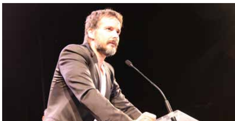
Sopar de les Àvies.