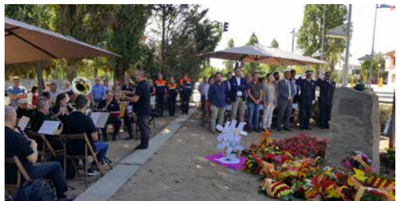
Cant d'Els Segadors.