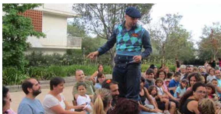
Espectacle infantil "Glof".