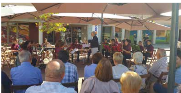
Trobada de bandes.