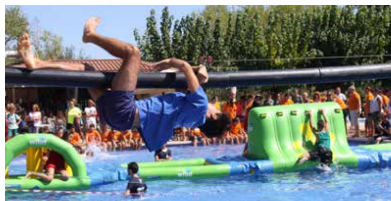
La Juguesca: Swimming pool challenge.