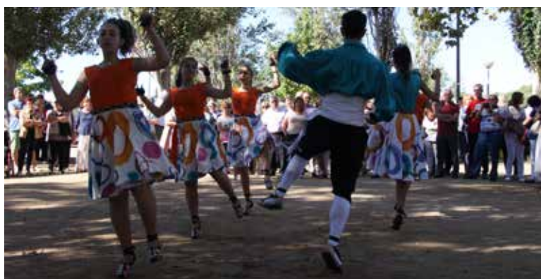
Ball de Gitanes.