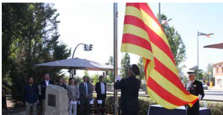
Hissada de la Senyera.

El manifest institucional parlava de l'Onze de Setembre com un dia en què el poble català surt al carrer per reivindicar l'avenç dels drets nacionals i socials de Catalunya, una Catalunya que s'ha de pensar, defensar i construir sencera, sense exclusions i en llibertat.