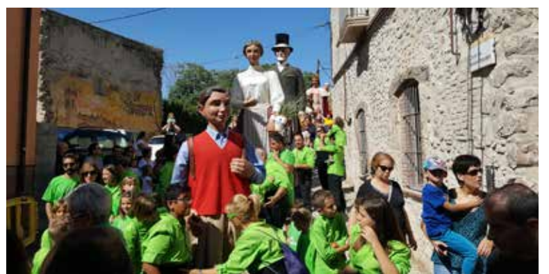
Cercavila de gegants i geganteres.