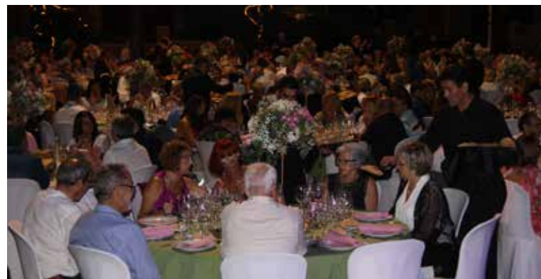
Sopar de les Àvies.