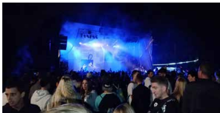
Vaparr Tour de Ràdio Flaixbac.