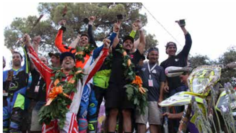
L'equip guanyador de la categoria absoluta en el podi.