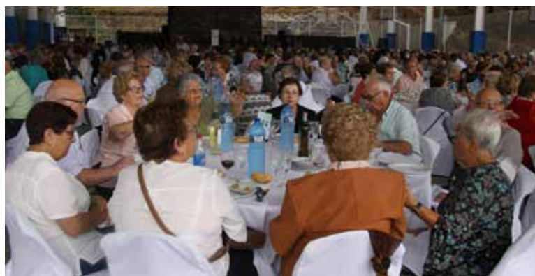
Festa d'Homenatge a la Vellesa.