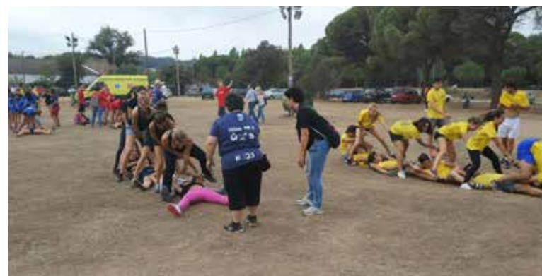
La Juguesca: Cinquens de final.