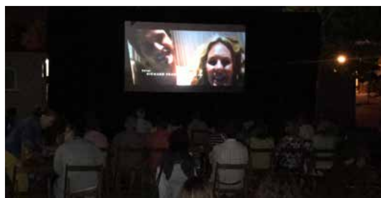
Cinema a la fresca.