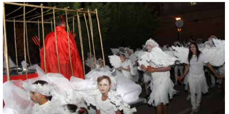
La Juguesca: Cercavila de carrosses.