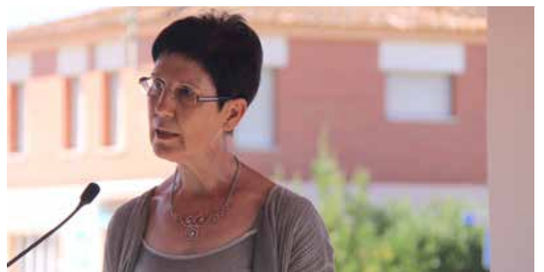
Lectura del Manifest.