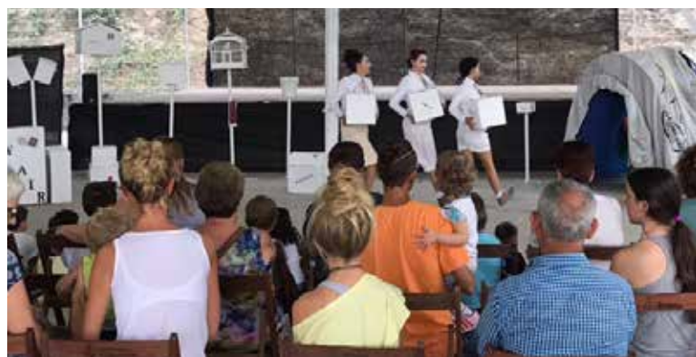
Espectacle infantil "Post".