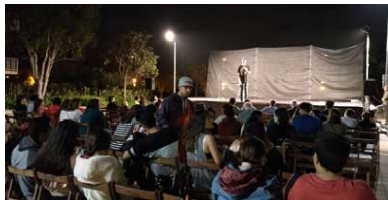
Nit de monòlegs.