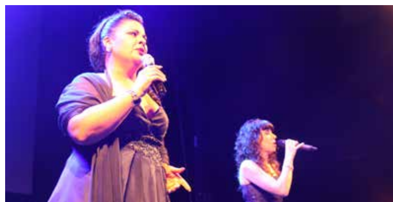
Sopar de les Àvies.