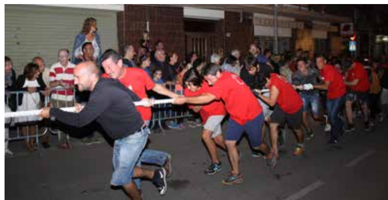
La Juguesca: Estirada del tractor.