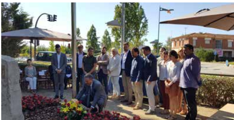
Ofrena floral al Monument del Tricentari.