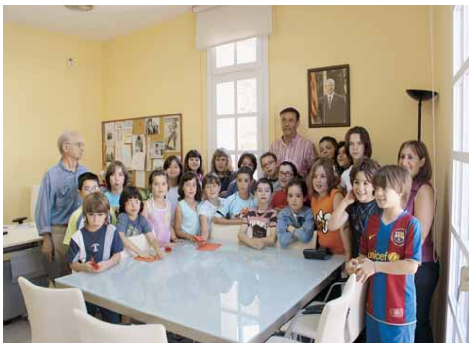
3R DE PRIMÀRIA DEL CEIP SANT BALDIRI