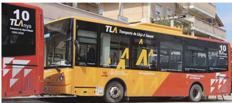
FLOTA RETOLADA AMB EL LOGO DEL 10È ANIVERSARI

Durant aquest període, en tots els actes, tallers i activitats en els quals pren part Transports de Lliça d'Amunt es farà esment als 10 TLA anys i s'obsequiarà als participants amb un recordatori editat per a l'ocasió.