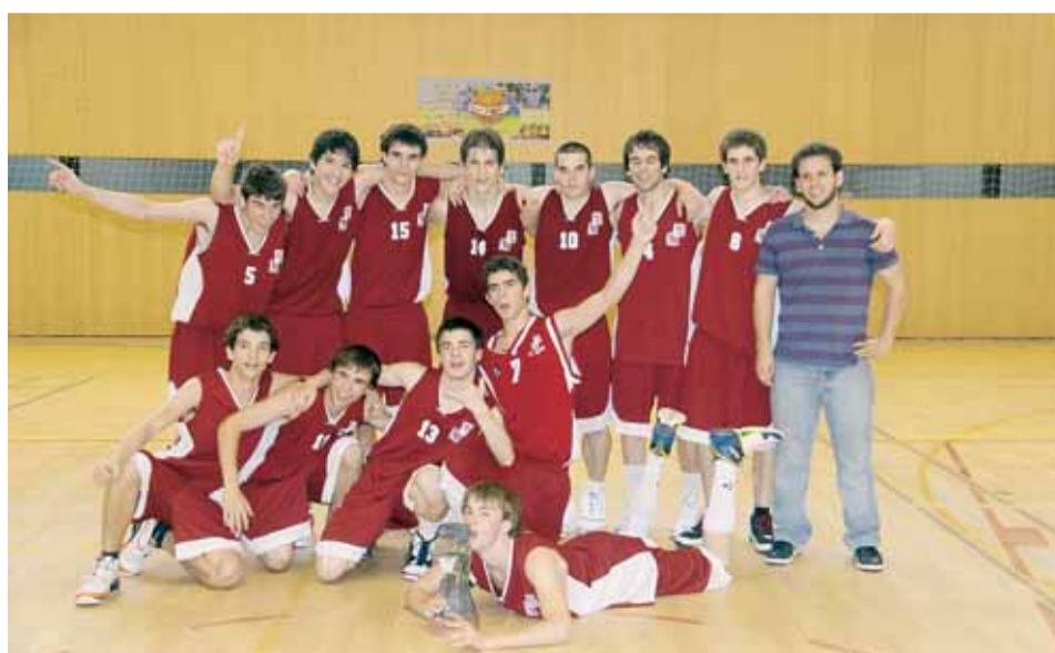
ELS GUANYADORS, EL C.B. SANTPEDOR