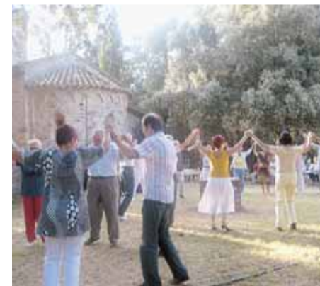
APLEC DE SANT JUSTA DE L'ANY PASSAT

L'acte comptarà amb una audició de sardanes amb la Cobla Principal de l'Escala . Seguidament, hi haurà una celebració eucarística. I, per finalitzar, s'oferirà un concert amb el grup musical Havaneres terra endins . També es repartirà coca i vi bo.