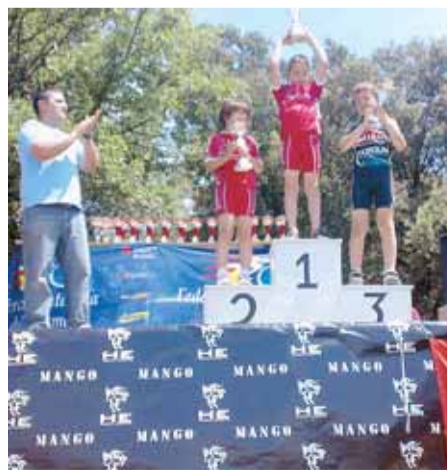
ELS LLIÇANENCS TAMBÉ VAN PUJAR AL PODI

Va ser una cursa molt profitosa pels ciclistes locals que van aconseguir varis podis en diferents modalitats.