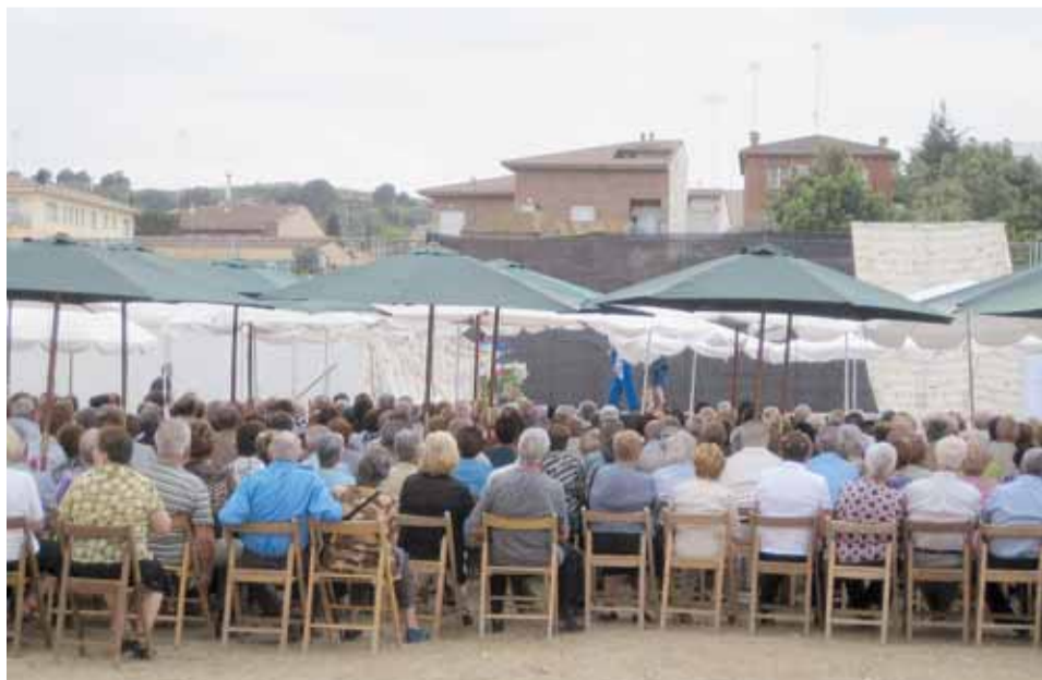
CONCERT DE SARSUELA AL PATI