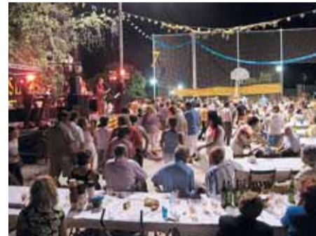
SOPAR I BALL

A continuació us detallem la programació de les festes de barri d'enguany per a tots els veïns de Lliçà d'Amunt de cada barri i els d'altres barris que vulguin compartir la seva festa.