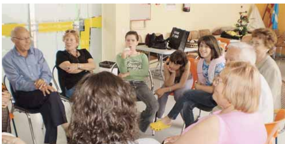
DEBAT ABANS DE LA POSADA EN ESCENA