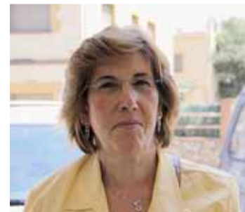
Antonio Piña Pinedes del Vallès

Sí, me suena. La forman Lliçà d'Amunt, Lliçà de Vall, Santa Eulàlia i Bigues. ¡No he hecho viajes con mis hijos al instituto de Santa Eulàlia, a todas horas!