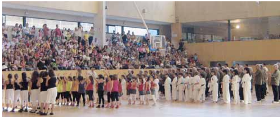
PARTICIPANTS AL FESTIVAL D'ENGUANY

Un cop acabades les exhibicions, el festival va finalitzar amb una caiguda de globus damunt dels esportistes que, tot ballant al ritme de la música, van desitjar molt bon estiu a tot el públic present.