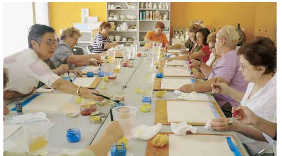
PARTICIPANTS DEL TALLER D'ART-TERÀPIA AL CASAL DE LA GENT GRAN

consultar la programació a través de la secció de l'Espai Dona del web municipal ( www.llicamunt.cat ).