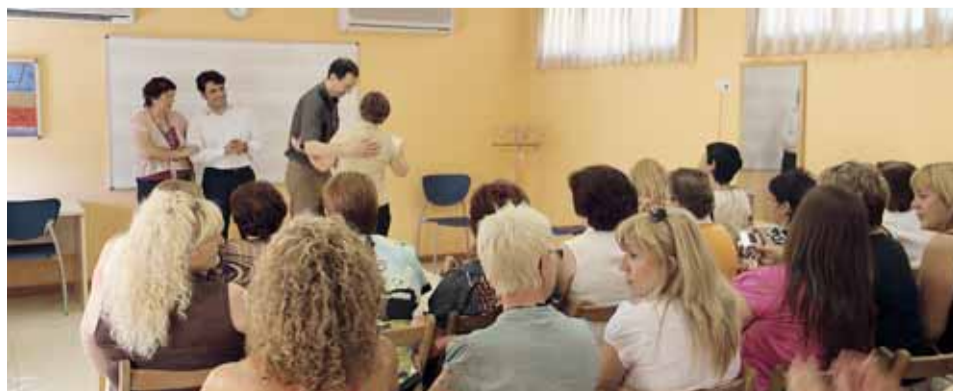
LLIURAMENT DE DIPLOMES

Segons els organitzadors, el nivell de satisfacció de l'alumnat que ha seguit el curs ha estat molt alt.