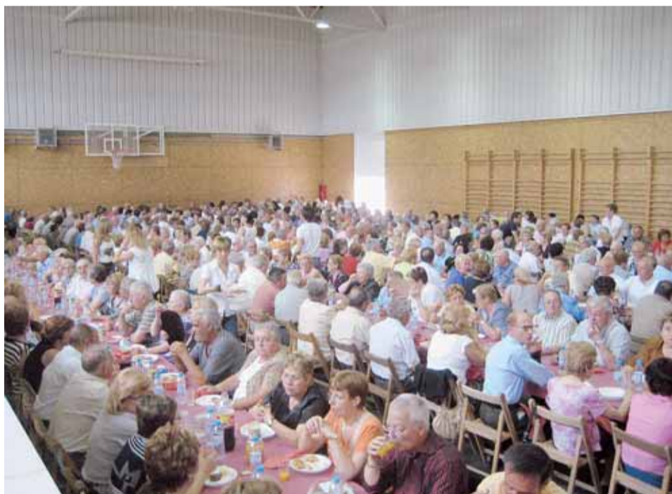
BERENAR AL PAVELLÓ

La cita d'enguany va tenir lloc el dissabte 23 de maig, a partir de les 17 h, a l'IES Lliçà. L'activitat va consistir en un concert de sarsuela al pati i seguidament un berenar al pavelló.