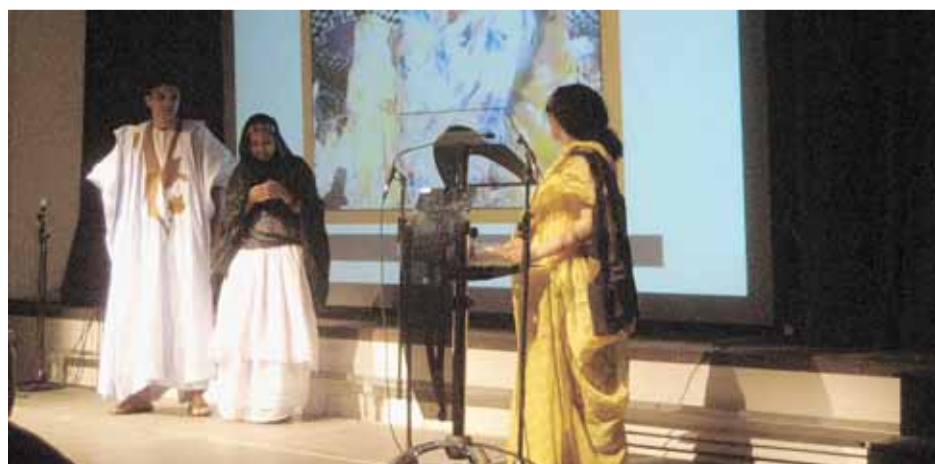
LLENGÜES DEL MÓN A LLIÇÀ D'AMUNT

Es tracta d'un espectacle que ens permet escoltar i descobrir la gran diversitat lingüística i cultural existent a Lliçà d'Amunt a través de cançons, contes, dites, músiques, informacions de ciutats o llocs del món, etc.