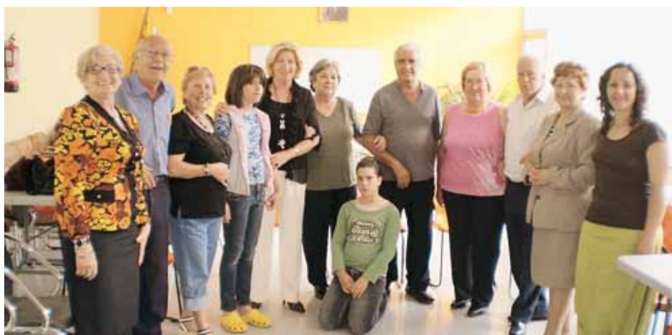
PARTICIPANTS AL TALLER

El taller va acabar el passat 4 de maig amb un berenar i un obsequi per part dels participants a la professora. I amb una petició per part de tots: "Volem que això segueixi".