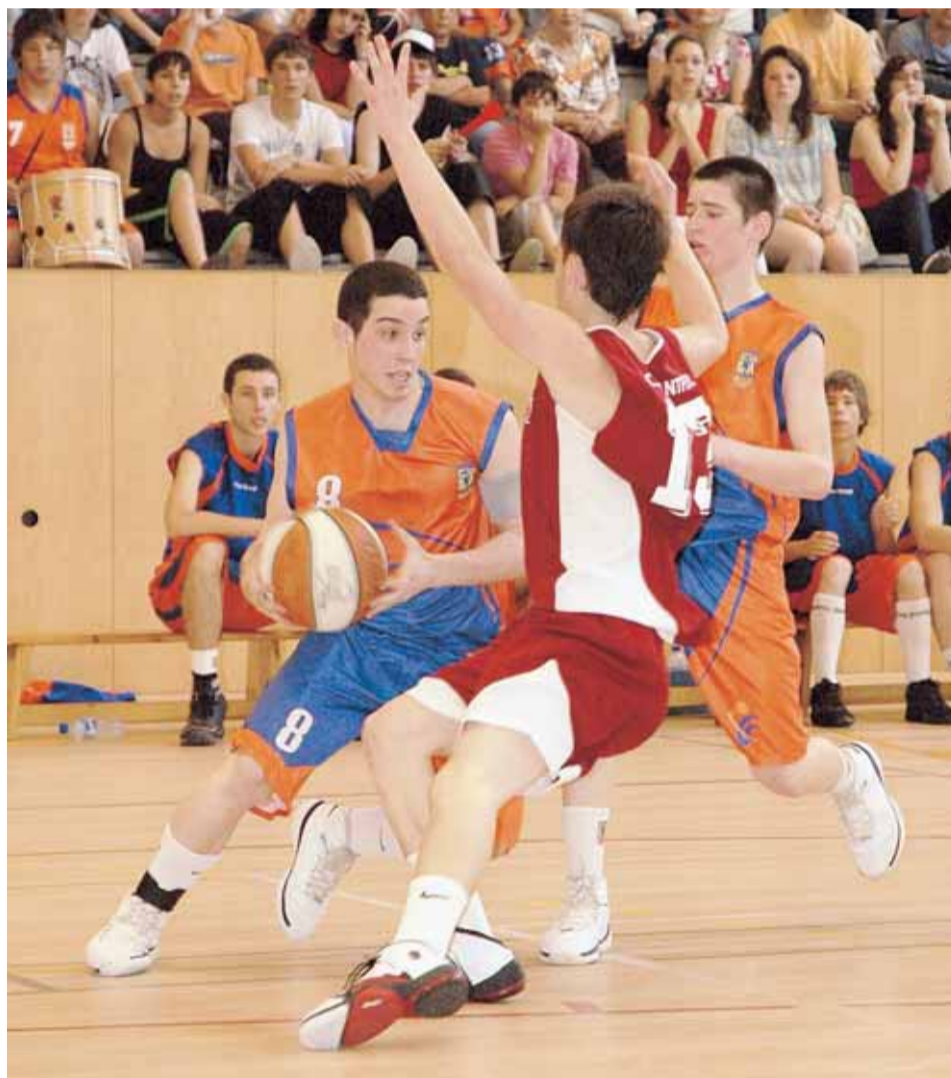
LLIÇÀ D'AMUNT-C.B. SANTPEDOR