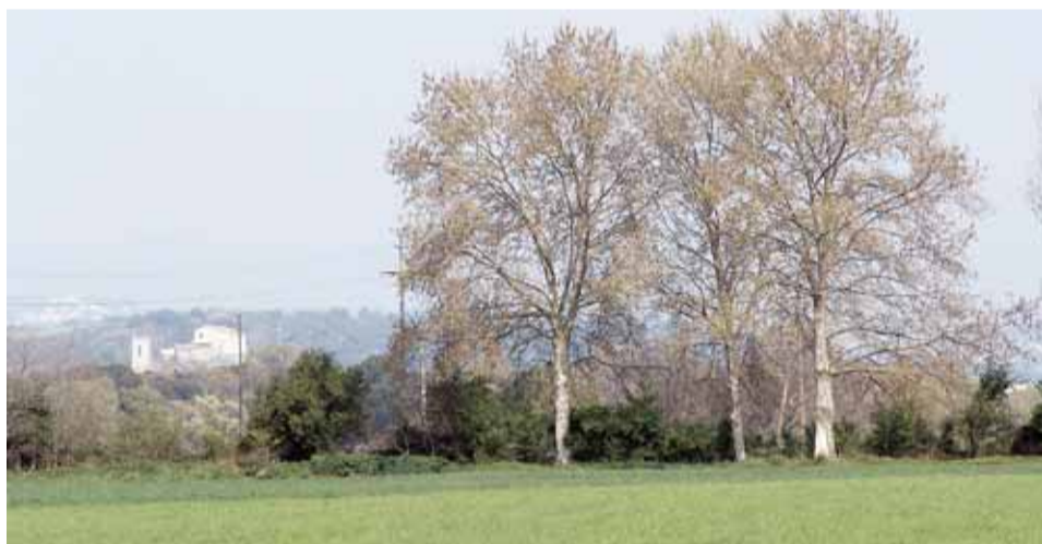
PLANA AGRÍCOLA DEL TENES AMB LA MASIA DE CAN PUIG I L'ESGLÉSIA DE SANT JULIÀ AL FONS