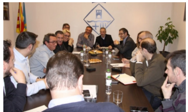
Moment de la reunió de treball.

Els equips de govern de Lliçà d'Amunt i Granollers van celebrar una reunió de treball, el passat 16 de gener a l'Ajuntament del nostre municipi, per parlar de diferents temes d'àmbit supramunicipal d'interès comú per a les dues poblacions veïnes, per tal de trobar sinèrgies de coordinació.