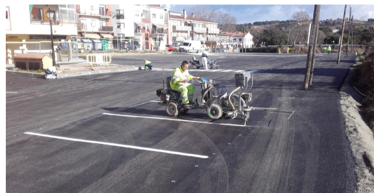
Aparcament del carrer de l'Aliança

de l'Aliança i del costat de la Piscina Municipal ja estan acabades (asfatge i pintura), i obertes al públic des de finals de gener.