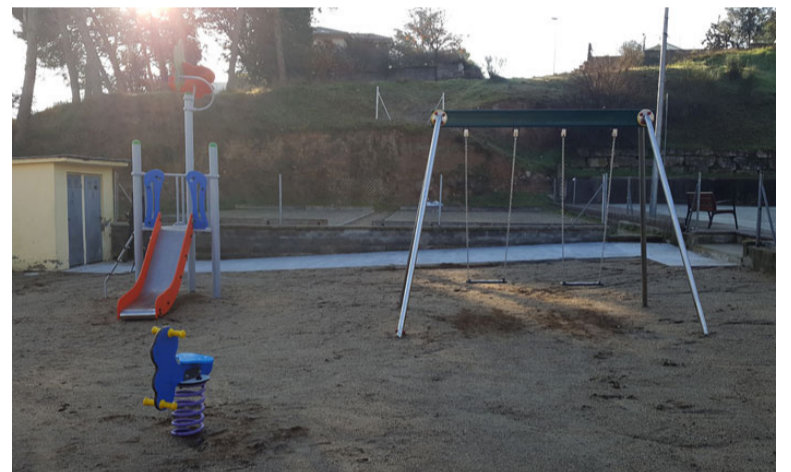
Parc de l'Esport de Can Rovira Vell

col·locat més bancs a la zona. El proper parc que estrenarà nous elements de joc serà el de la República, situat a Ca l'Artigues, davant de l'escola Rosa Oriol.