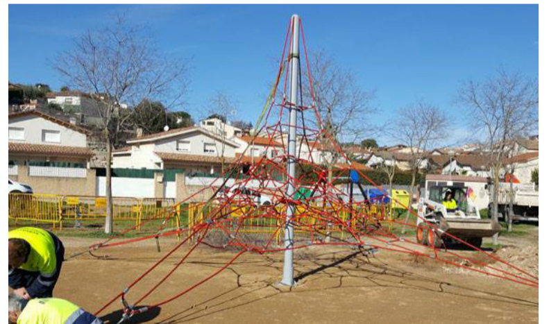
Parc de la República, a Ca l'Artigues, davant de l'escola Rosa Oriol