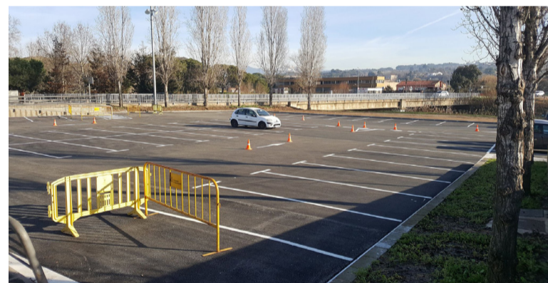
Aparcament del costat de la Piscina Municipal