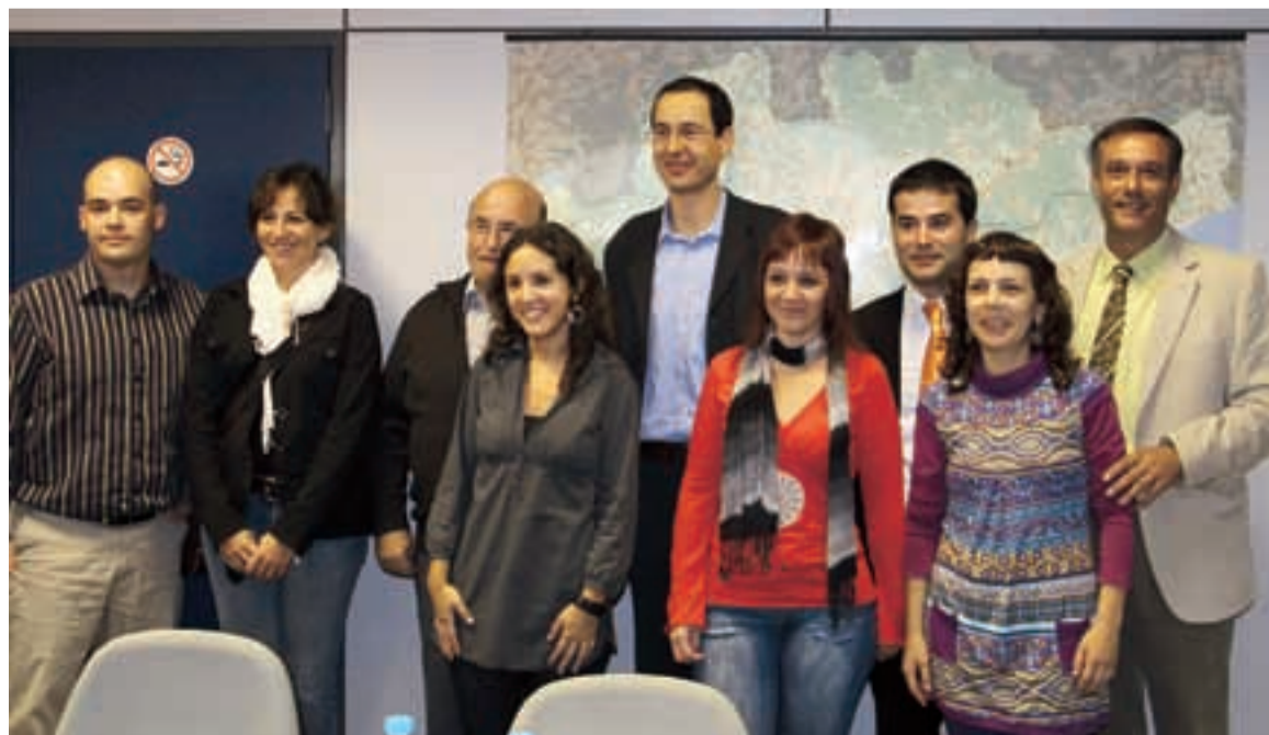
ALCALDES I EDUCADORS SOCIALS IMPLICATS EN EL PROJECTE

En aquest protocol d'actuació hi estan implicats la Policia Local, els Mossos d'Esquadra, Serveis Socials, les regidories de Joventut, el CAS de Granollers i el PPD.