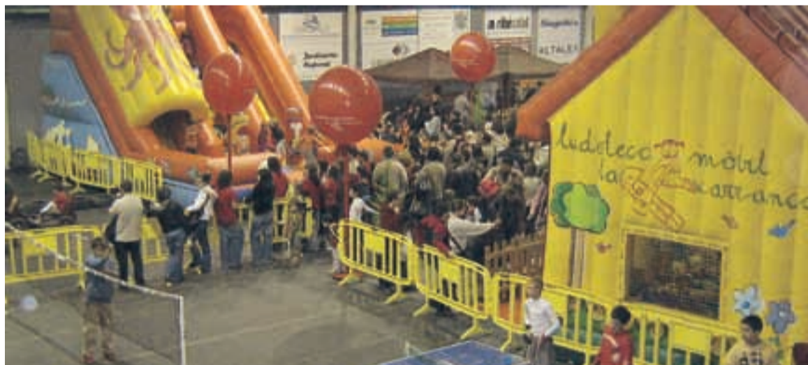
PARC INFANTIL I JUVENIL DE NADAL