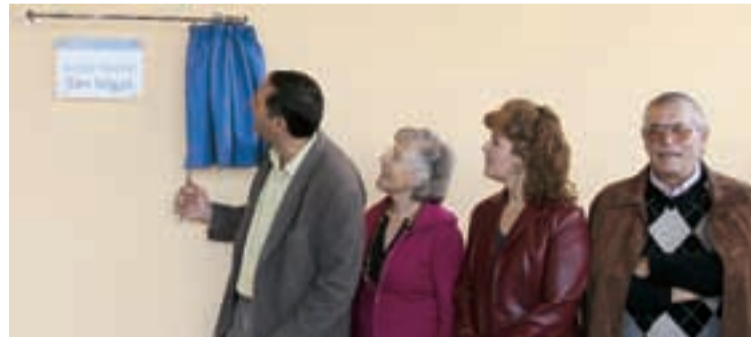
DESCOBRIMENT DE LA PLACA

El nou equipament consta d'una àmplia sala polivalent, de 130 metres quadrats, distribuïda en diferents espais: zona infantil, bar, zona per exposicions, etc. A banda, hi ha dos magatzems, tres lavabos i un despatx per a l'associació de veïns. Aquests espais estan separats a través de la decoració pròpia de cadascun d'ells, de manera que en el local social predominen els espais oberts. El local social té un pati al davant força ampli i un pati posterior que arriba fins al carrer paral·lel, el carrer Palamós, a més d'una terrassa lateral també molt gran. En el pati posterior hi ha prevista la ubicació d'un espai infantil i un altre per a la gent gran, a més d'una zona de petanca.