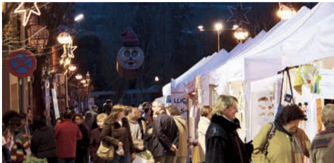
FIRA DE NADAL