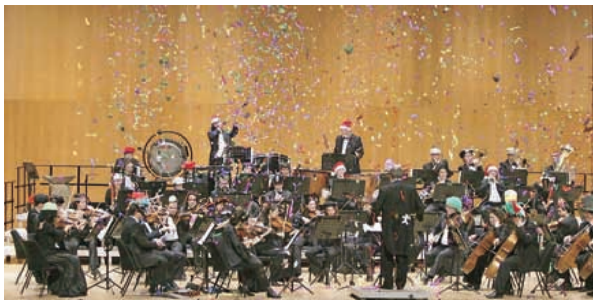
ORQUESTRA SIMFÒNICA SANT CUGAT

A més, com ja és tradicional al nostre municipi, en aquestes dates nadalenques, s'oferirà un Concert de Cap d'Any. Aquest concert, que serà gratuït, tindrà lloc el divendres 1 de gener, a les 19 h, al Pavelló Municipal d'Esports, i anirà a càrrec, com l'any passat, de l'Orquestra Simfònica Sant Cugat. Es tracta d'un concert inoblidable, amb les obertures, marxes, valsos i polques de la família Strauss, majoritàriament del compositor Johan Strauss, que ens farà passar una vetllada plena d'alegria i amb moltes sorpreses. Un concert que combina la bona música i el bon humor per gaudir entre familiars i amics.