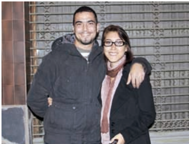
PRIMERA PARELLA PER ESCOLLIR HABITATGE

El llistat d'adjudicatari i l'ordre d'adjudicació es pot consultar al web municipal www.llicamunt.cat .