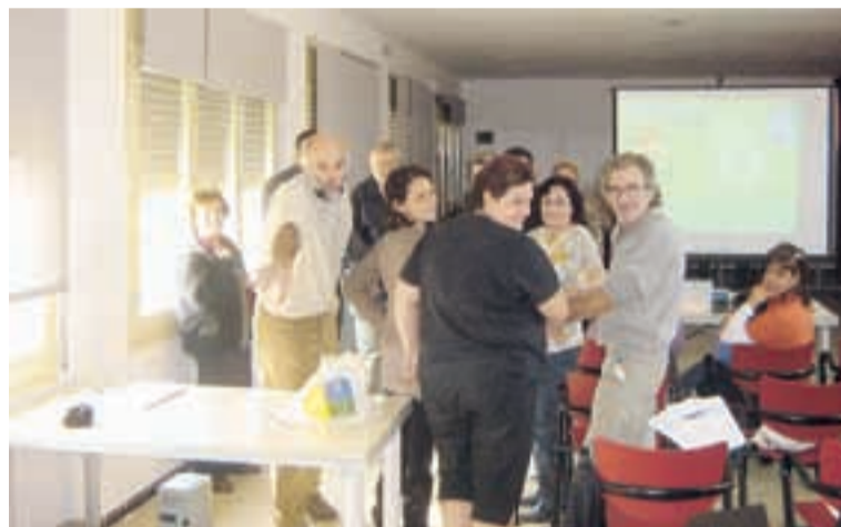
ASSISTENTS AL CURS

Els passats 30 i 31 d'octubre es van realitzar dues noves sessions de formació de compostatge domèstic, amb una assistència total de 42 persones.