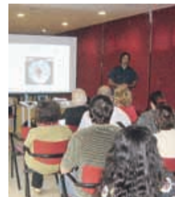
ASSISTENTS AL CURS

Més informació de noves convocatòries o altres a l'Ajuntament, telèfon 93.841.52.25.