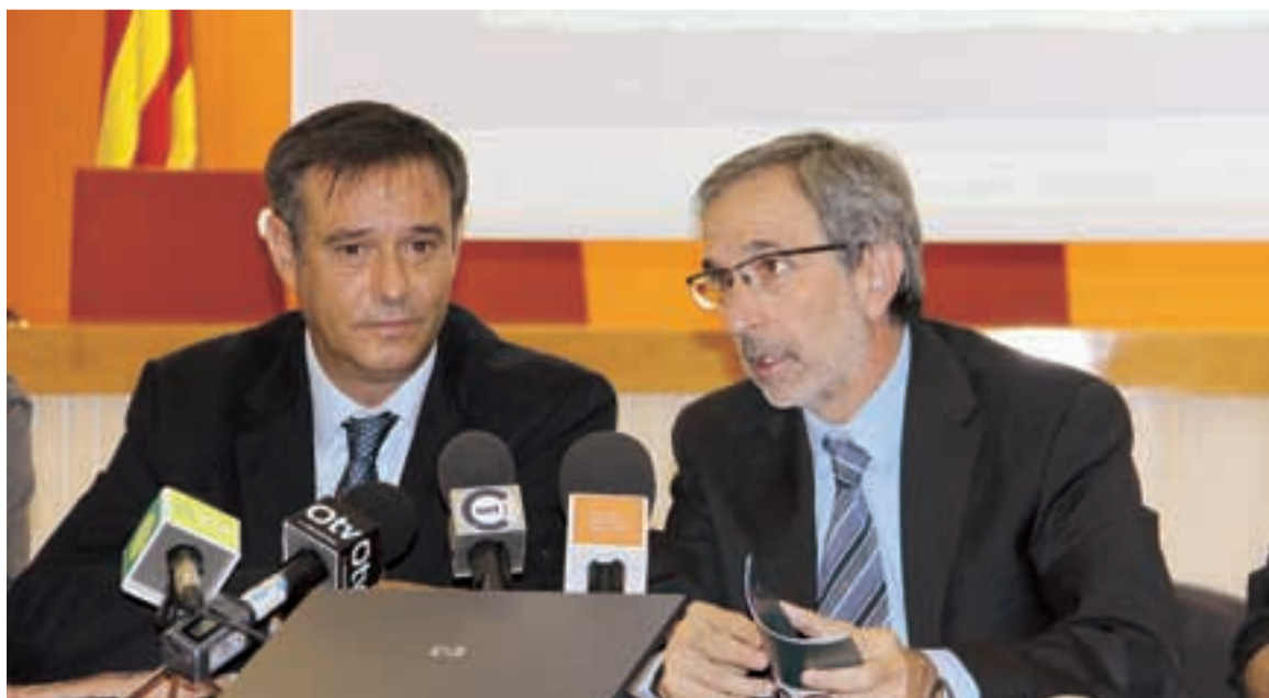
PRESENTACIÓ DE LA GUIA

Cal destacar que aquesta guia neix del treball conjunt de diferents professionals i agents de la Vall del Tenes i Granollers, que ja realitzen treball en xarxa al seu territori, i alhora complementa tota la tasca de prevenció que es realitza des d'ambdós ens municipals.