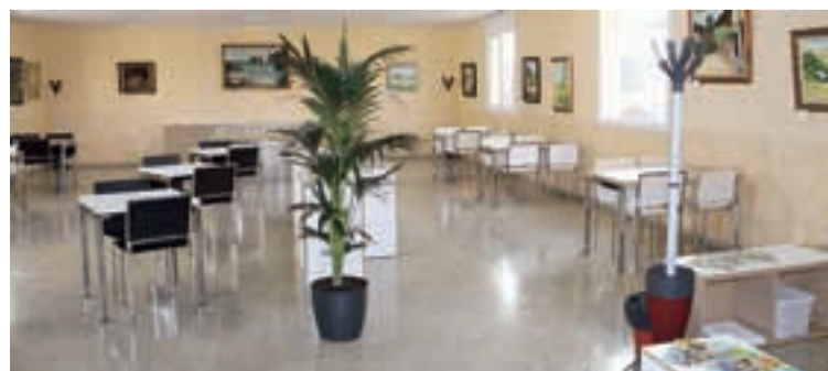
INTERIOR DEL LOCAL SOCIAL